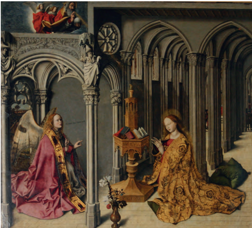
Annunciatietriptyek van Aix (middendeel), Barthélemy van Eyck, 1443-1445, Église Sainte-Madeleine, Aix-en-Provence. Dit werk is compositorisch verwant met de Annunciatie van Jan van Eyck, een werk van een decennium eerder, dat in Washington bewaard wordt (zie blz. 180).