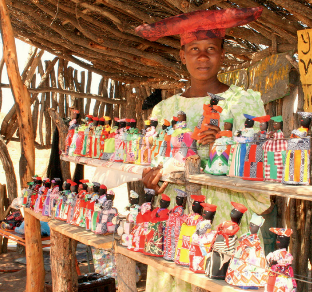
En man van de Herero-stam, afkomstig uit Namibia, Afrika. Deze Herero verkoopt zelfgemaakte poppen met opvallende hoeden en kleuren.

sociaal masker was. Relativeren inderdaad. Je vindt niets meer normaal. Of alles. Duizenden redenen om op reis te gaan. En als je eenmaal reist, lijkt de wereld uit louter reizigers te bestaan. Is het bijna onwezenlijk dat er ook een universum is waar mensen om acht uur 's ochtends naar kantoor gaan.