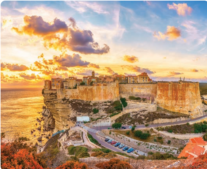
Bonifacio (blz. 194) in Corsica, torent 80 meter boven de zee.