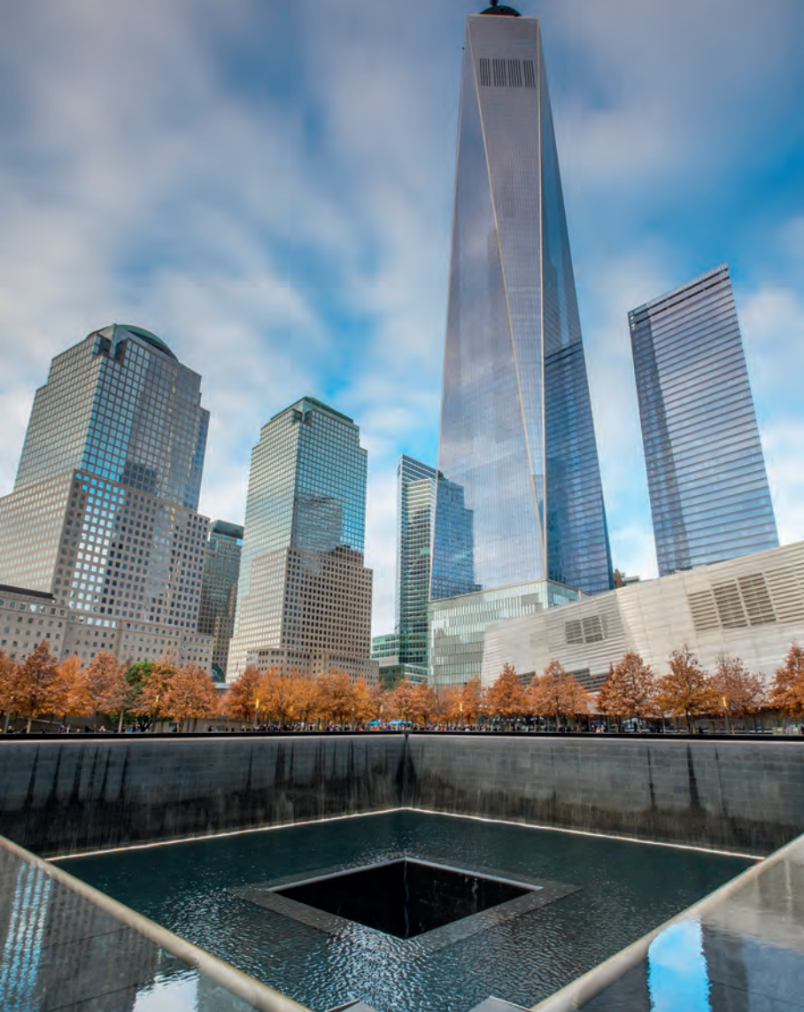
Het 911 Memorial in Lower Manhattan herinnert aan die noodlottige 11 september 2001.