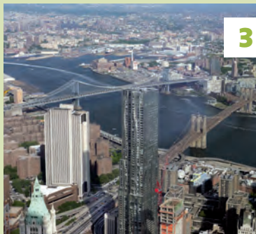
One World Observatory ★★★