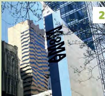
Museum of Modern Art ★★★