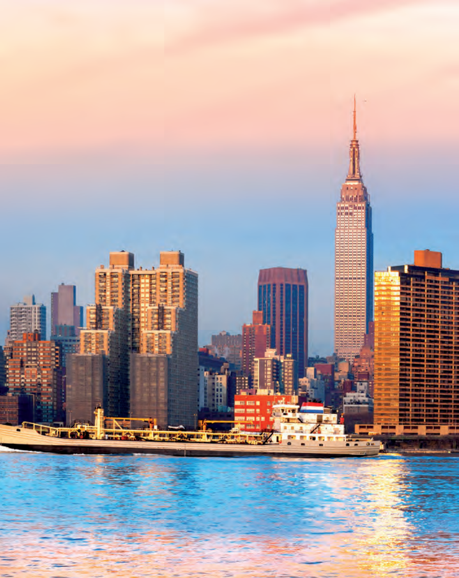
Uitzicht op Midtown Manhattan met prominent de Empire State Building