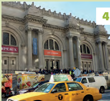
Metropolitan Museum of Art ★★★