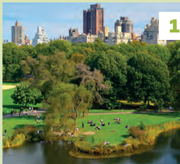
Central Park ★★★