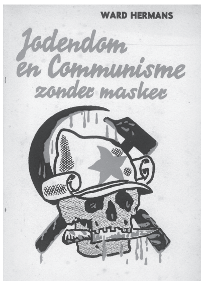
Rechts zijn eerste antisemitische publicatie.