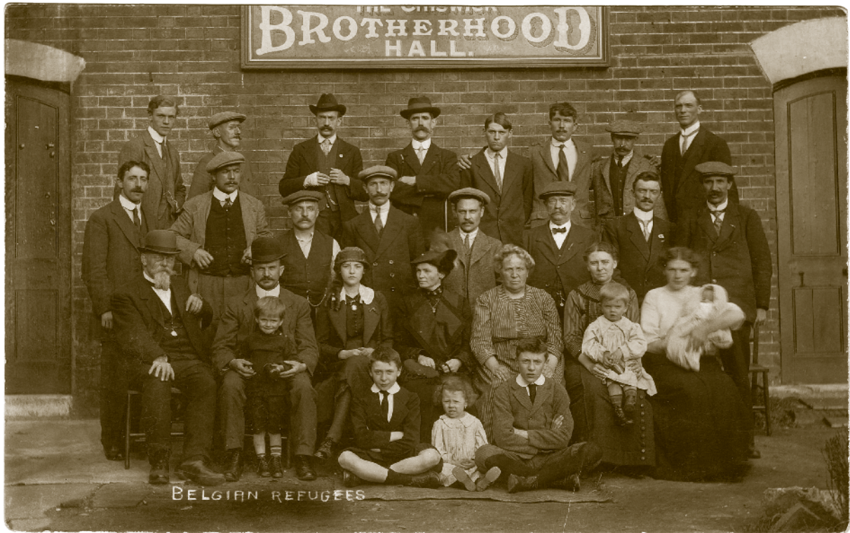
▲ Belgische vluchtelingen in Chiswick, ten westen van Londen.