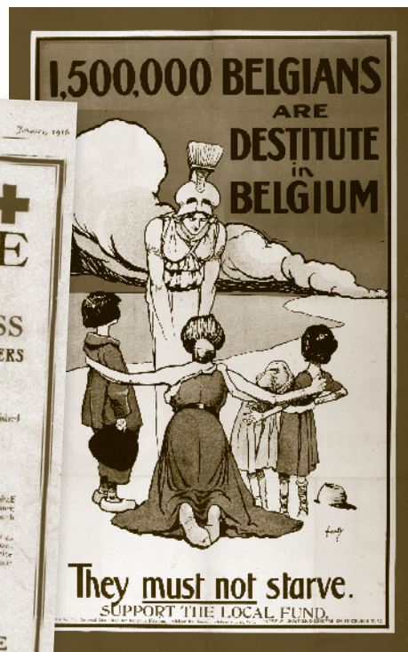
▲ In Groot-Brittannië kwam jegens de Belgen een ware golf van solidariteit op gang.

Tegen eind augustus 1914 werd Folkestone werkelijk overspoeld door duizenden vluchtelingen.