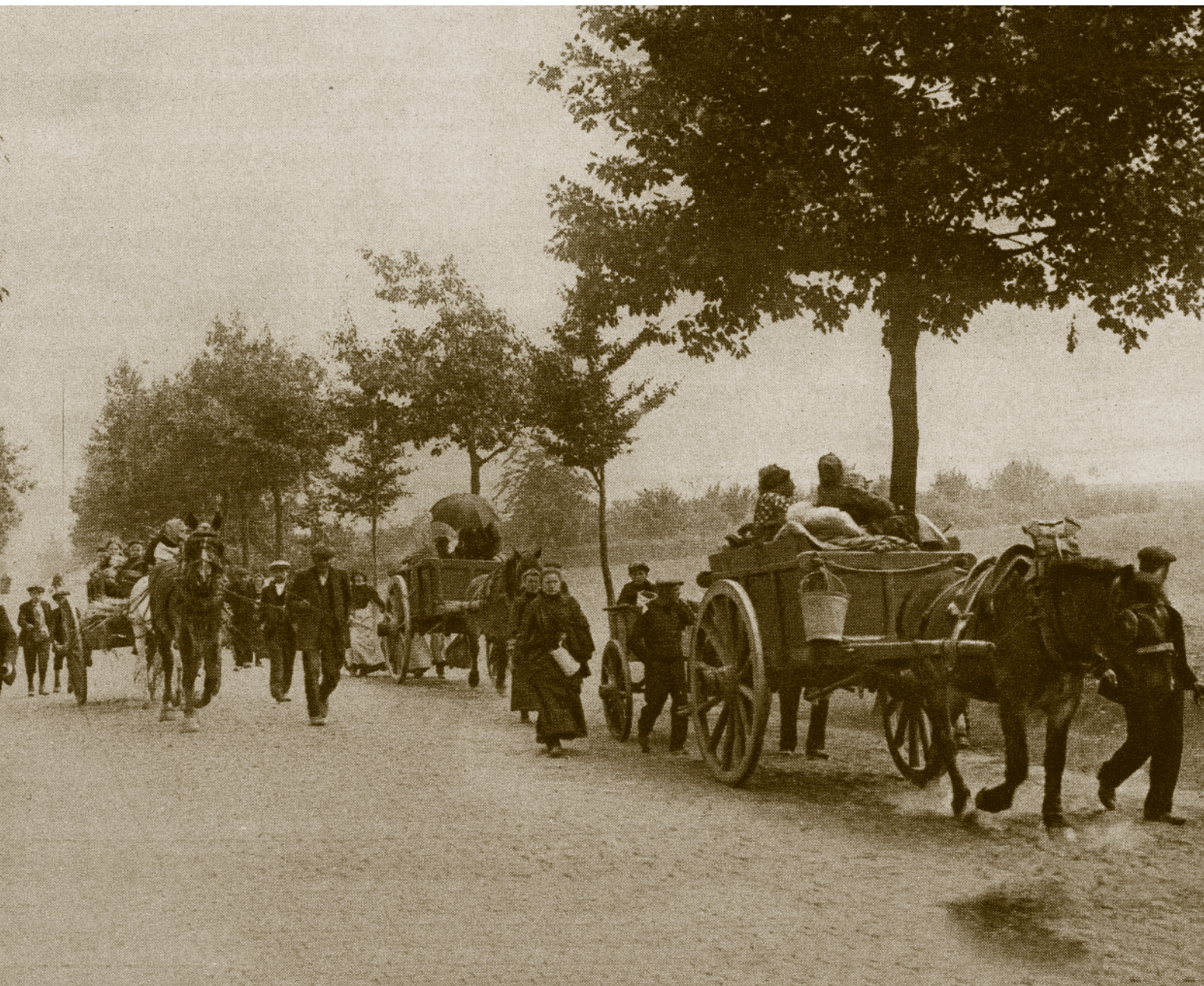
▲ Belgische vluchtelingen in augustus 1914, ergens tussen Leuven en Brussel.