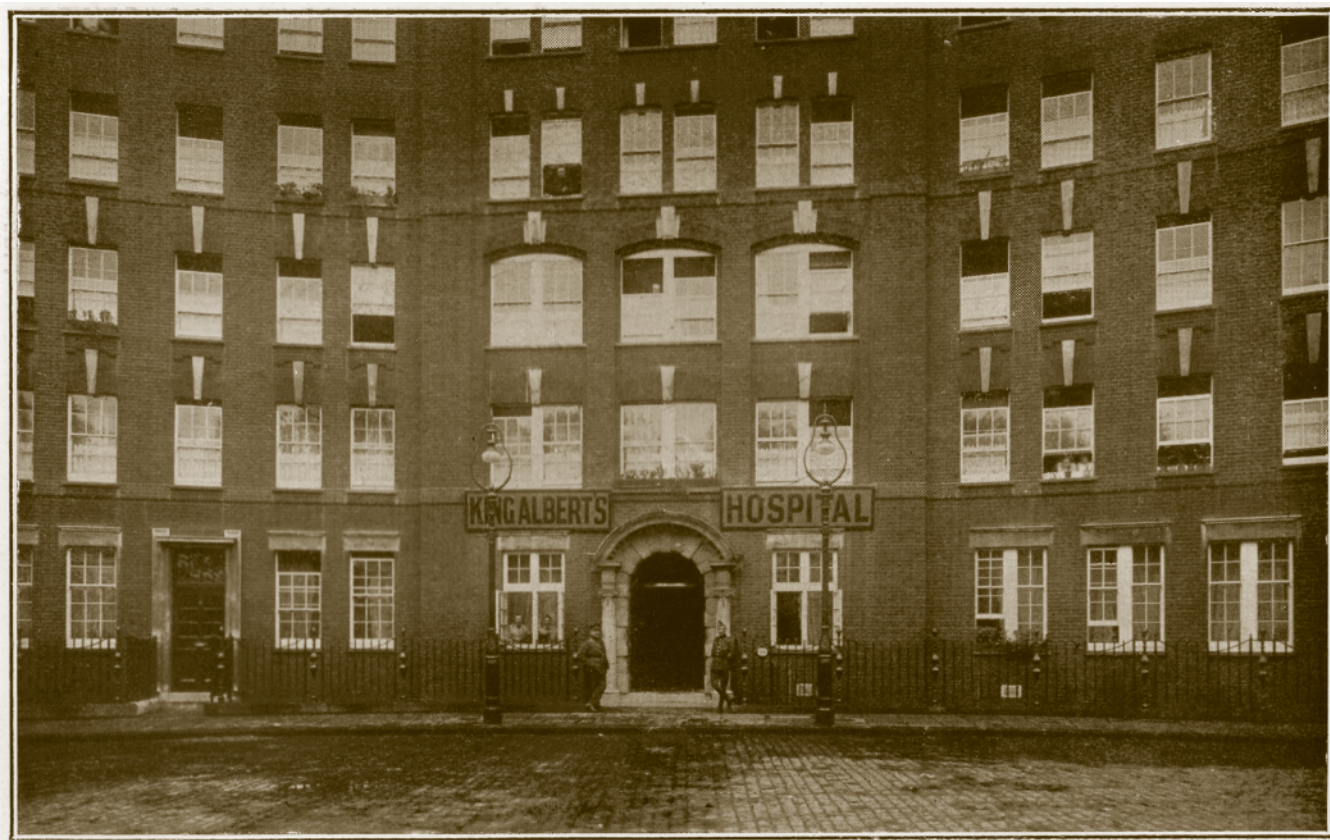
▲ Een van de vier Belgische hospitalen in Engeland: het King Albert's Hospital in Store Street in Londen.

Biezen, Oudekapelle en Abele. Die medische accommodatie was onvoldoende om de toevloed aan patiënten aan te kunnen. Patiënten werden daarom doorgestuurd naar hospitalen in Frankrijk of Engeland.