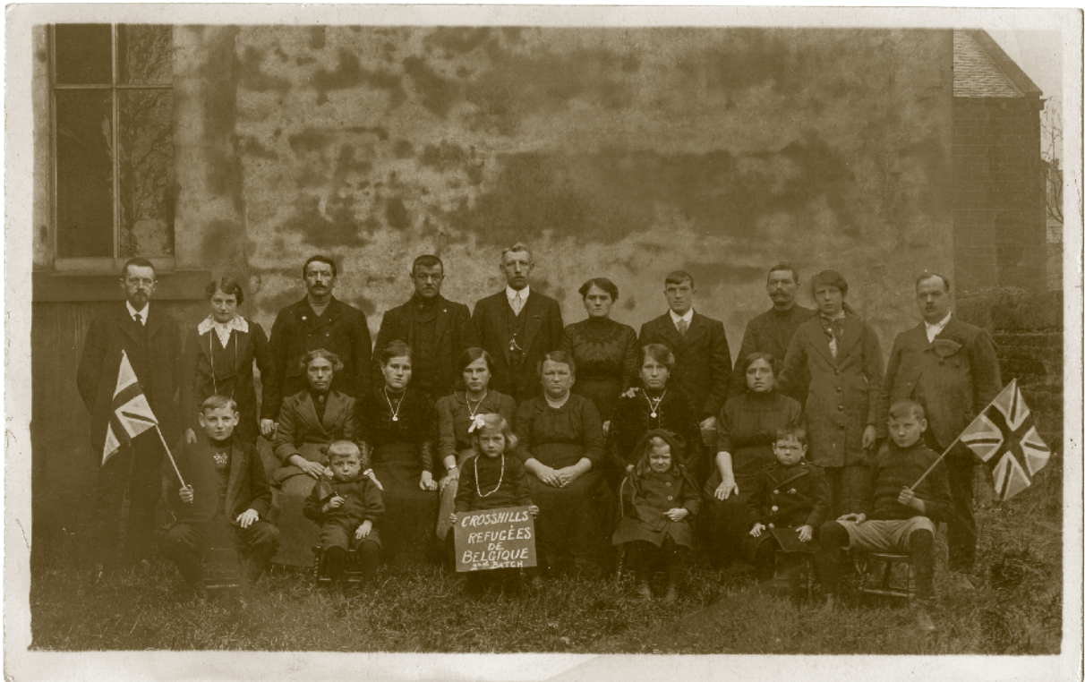
▲ Belgische vluchtelingen met Britse vlaggen in Croshills in North Yorkshire.