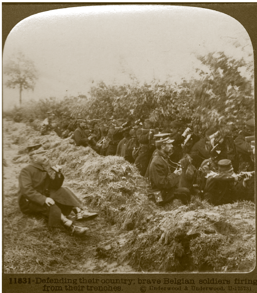
11831-Defending their country, brave Belgian soldiers firing from their trenches.