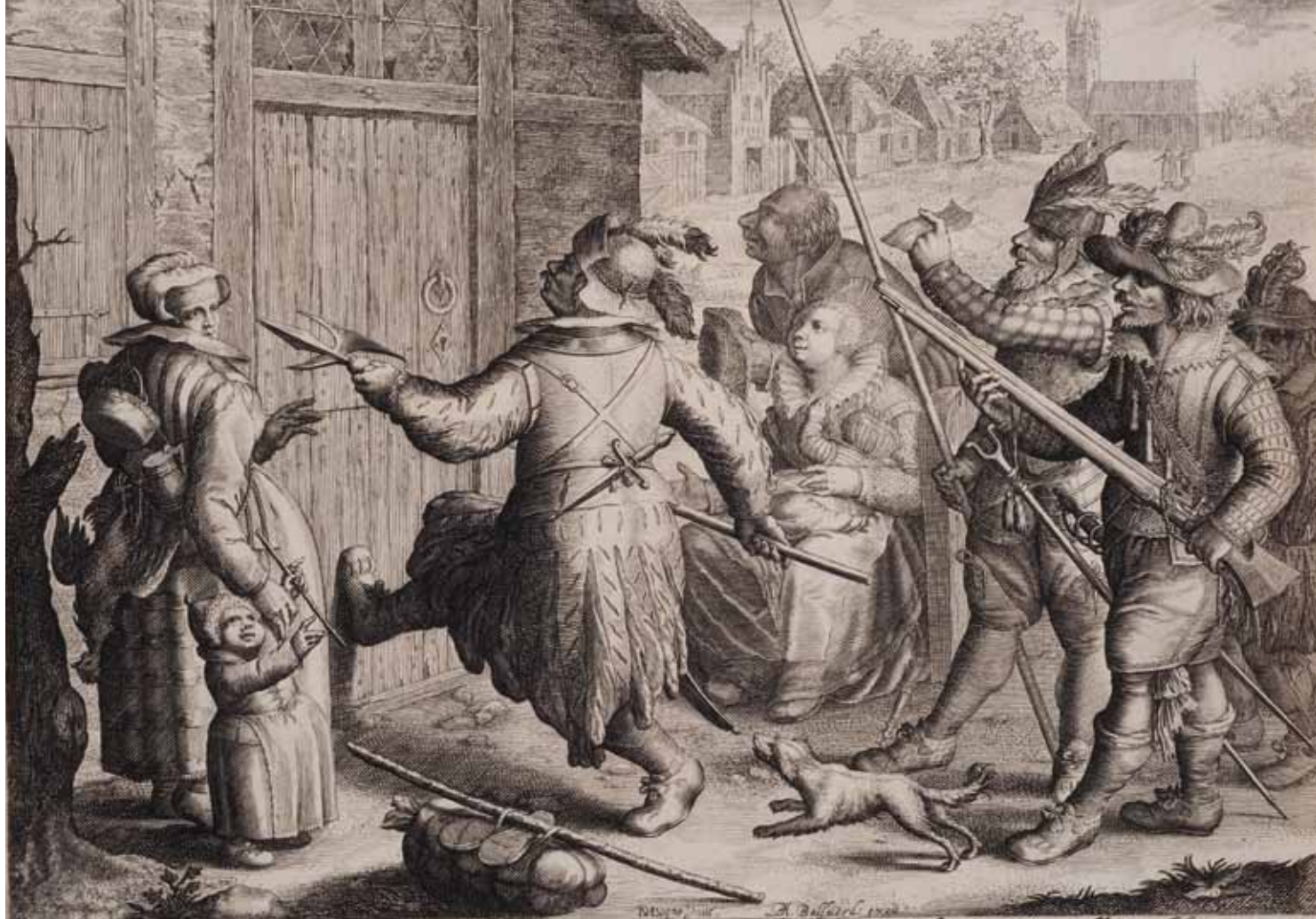
Boëtius Adamsz. Bolswert naar David Vinckboons Boerenverdriet , 1610 Gravure, ca. 206 x 286 mm (elk)

Hou boer deel op niet dat yk heest. Doet ghy niet op so vrank van moest.