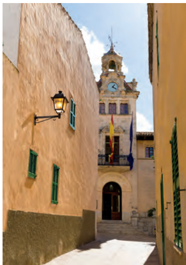
Het stadhuis in Alcúdia