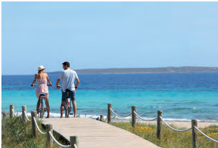
Het blauwe water rondom Formentera

van het glorierijke verleden van de stad.