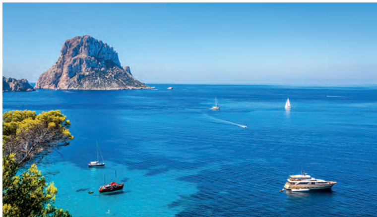
Cala d'Hort, Ibiza

kubusvormige huizen met witgekalkte muren. Tijd nu voor de zee en een duik in een van de calas aan de westkant van het eiland, met een kleine voorkeur voor de Cala d'Hort (blz. 109). Een laatste halte in het dorp Es Cubells , op de rand van de kliffen.