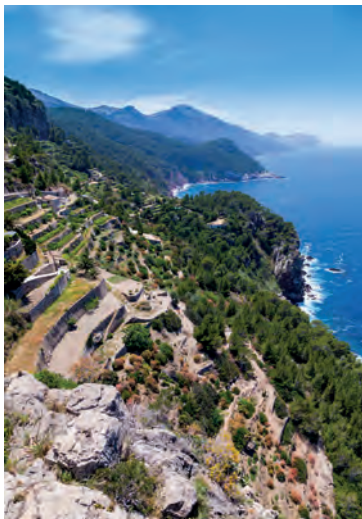
Plantages in Banyalbufar

Keer terug naar Palma via de weg naar Manacor (blz. 74): ondanks een fraai klein museum is de stad enkel een stop