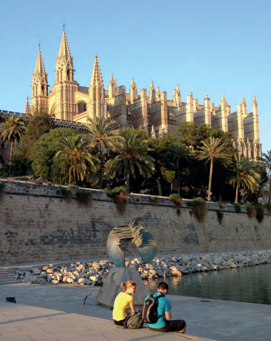
De kathedraal van Palma verandert van kleur naargelang van het tijdstip.