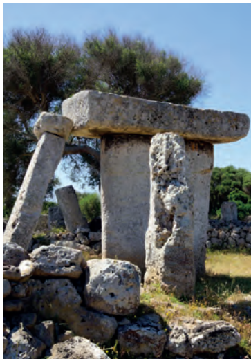
Talatí de Dalt, Menorca

Keer terug naar Palma ★★ (blz. 38) en kuier door de oude stad.