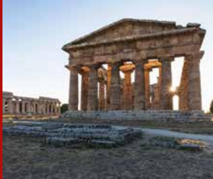
De tempel van Poseidon in Paestum

♥ Neurie de soundtrack van de film Il Postino terwijl u over het eiland Procida fietst. Rijd net als de postbode van Pablo Neruda boven langs de grote klif bij het strand Cala del Pozzo Vecchio en daal daarna af naar de zee en het mooiste strand van het eiland.