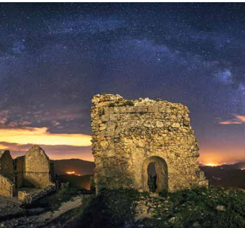
De Melkweg, gezien vanuit de Abruzzes

♥ Proef het ware Zuid-Italië , bijvoorbeeld orecchiette alle cime di rapa in Bari. Deze grappige pasta's worden geserveerd met een saus van anjovis, raapstelen en piment. Het is het typische basisvoedsel van het zuiden van Italië. Zie blz. 432.