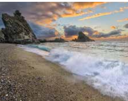
Scoglio dell'Ulivo, Palmi

Tips: sommige agriturismo's bieden ook wandelingen met gids aan, win informatie in. Vlieg heen op Napels en boek uw retourvlucht vanuit Lamezia Terme, op 1.30 uur rijden van Reggio. Dat levert u een extra halve dag farniente op.