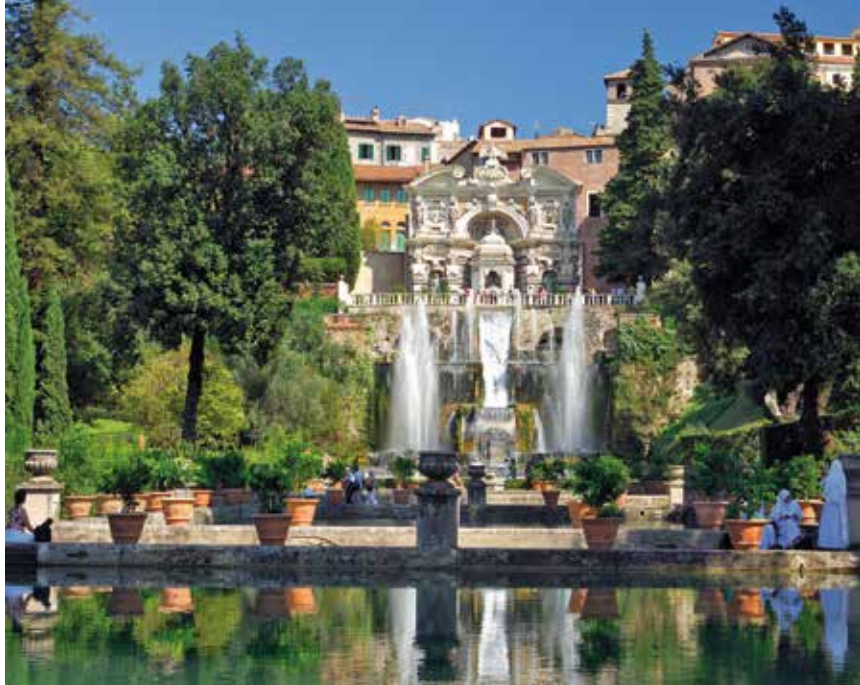
Villa d'Este