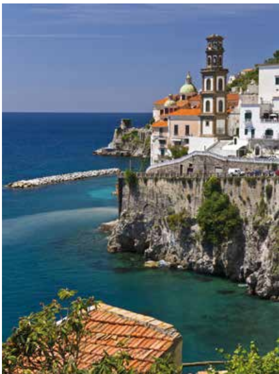
Het dorp Atrani, aan de Amalfikust