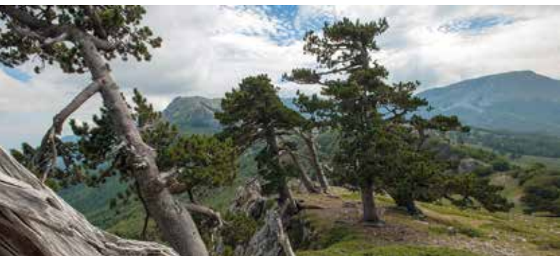
Balkandennen in de Pollino

♥ Ontdek de balkandennen van de Pollino, het enige massief in West-Europa waar ze nog voorkomen. Het zijn enorme, solitaire bomen die bizarre vormen kunnen aannemen. De den die 'de patriarch' wordt genoemd, is meer dan 1000 jaar oud. Zie blz. 524.