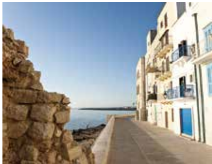
Monopoli Maremagnum/Stockbyte/Getty Images

Tips: vermijd de drukte van het hoogseizoen. Boek de hotels van tevoren, kies waar mogelijk voor agriturismo's.