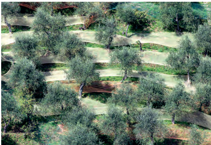
Olijfbomen in Ligurië

Als men iets van prima kwaliteit, grote creativiteit en natuurlijke elegantie ziet in de snit van een jas, het ontwerp van een stoel, de allure van een auto, is men al snel geneigd te zeggen dat het een Italiaans product moet zijn. Alessi, Armani, Ferrari, Gucci, Prada, Alfa Romeo, om maar enkele van de honderden bekende merken te noemen, zijn al meer dan zeventig jaar de ambassadeurs van de 'Made in Italy'-stijl. De luxe-industrie (auto's, huishoudelijke apparaten, kleding e.d.) heeft Italië in de top-5 van producerende landen geplaatst.