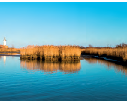
De Podelta Gim42/iStock

Mausoleo di Galla Placidia ( blz. 614 ), Basilica di San Vitale ( blz. 613 ), Basilica di Sant'Apollinare Nuovo ( blz. 617 ) en di Sant'Apollinare in Classe ( blz. 618 ). Terug naar Venetië.