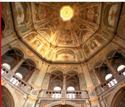
Koepel van de kerk in Sabbioneta

♥ Slenter door de Via Garibaldi in Genua en bewonder de twaalf prachtige paleizen in een van de elegantste straten van Italië. Ze vormen een uniek voorbeeld van de aristocratische stedenbouw in Europa. Zie blz. 211.