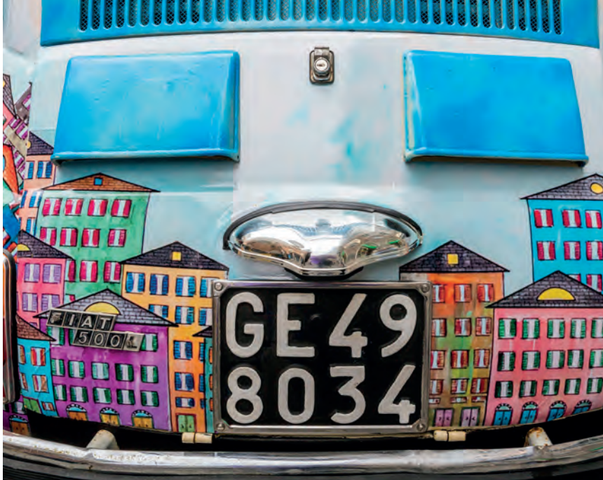
Fiat, een van de symbolen van het succes van Noord-Italië