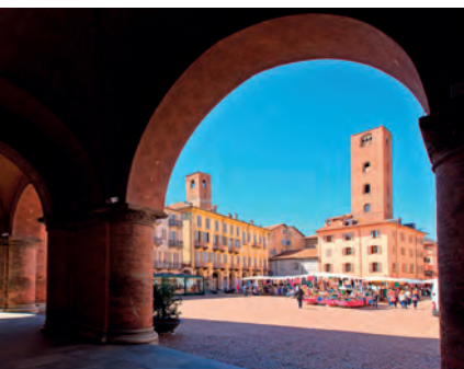
Onder de arcaden van Piazza del Risorgimento in Alba