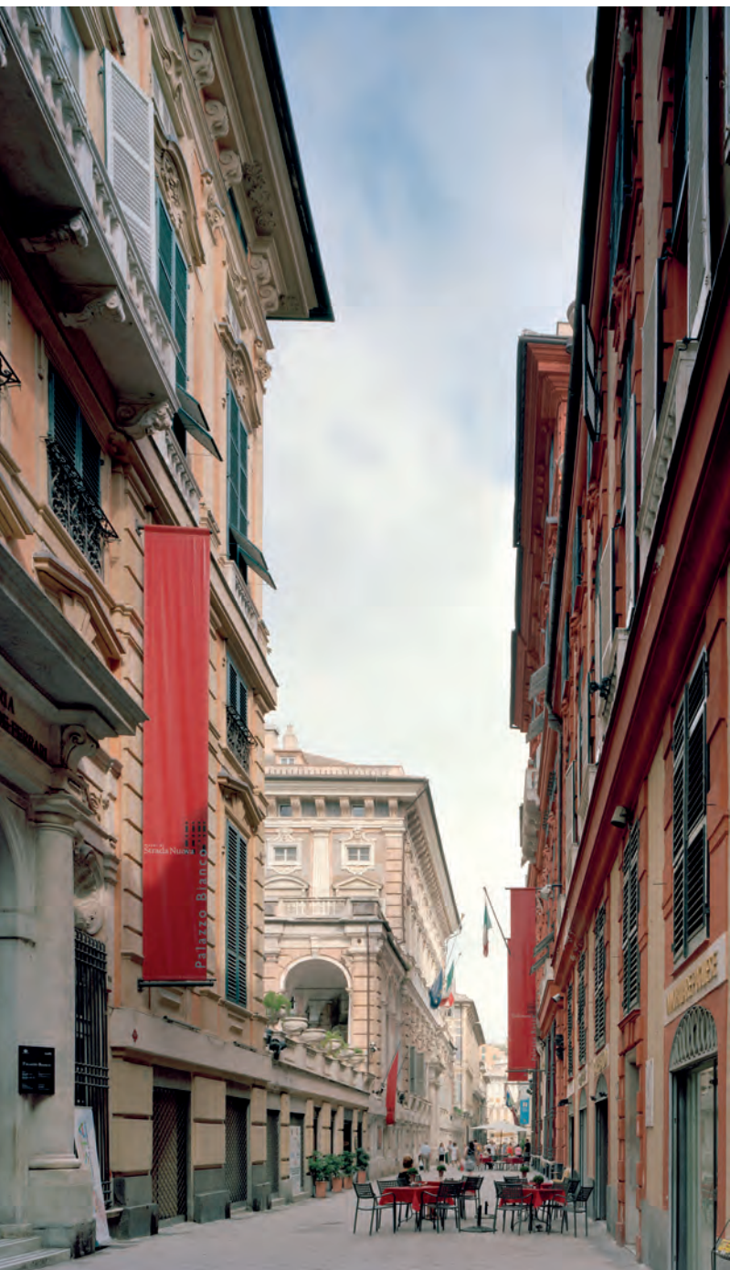
De paleizen van de Via Garibaldi in Genua