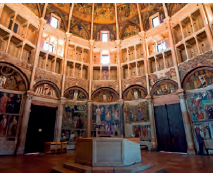
Fresco's in de Battistero in Parma

Tip: neem wat van de regionale specialiteiten mee: torrone (noga), parmigiano reggiano, balsamicoazijn, wijnen uit de Franciacorta.