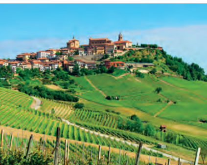
La Morra en zijn wijngaarden

Route: 320 km om de smaken van de Piemonte te ontdekken.