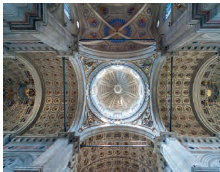
De Duomo in Como

Rondvaart op het Lago Maggiore ( blz. 338 ), wandeling op de Borromeïsche Eilanden ( blz. 339 ). De Mottarone ( blz. 340 ), de Villa Taranto ( blz. 341 ). Terug naar Milaan ( blz. 252 ).