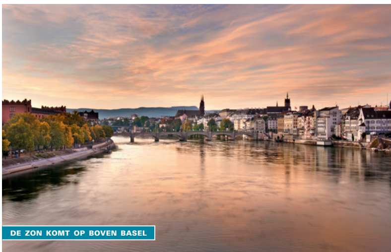
DE ZON KOMT OP BOVEN BASEL

🚶 Hôtel Bildungszentrum 21: Missionsstrasse 21 ☎ 061 260 21 21 🌐 bildungszentrum-21.ch ♿ Tweepersoonskamer 165-900 CHF. Parkeerterrein (betaald). Wifi. Net