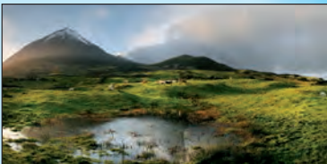
Pico Met 2351 m is de vulkaankegel van Pico de hoogste berg van Portugal. Het eiland is een ideale uitvalsbasis voor walvisobservaties.