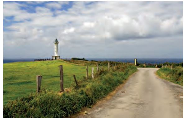
Een eenzame vuurtoren aan de Costa Verde.

Picos de Europa, 'bergpieken van Europa', doopten de zeelui de tot 2500 m hoge Noord-Spaanse bergketen met zijn steile rotswanden, diepe ravijnen en besneeuwde toppen. Veel neerslag en vaak dichte mistbanken doen een weelderige plantengroei ontspruiten van sappig groene weiden, loofbossen op de berghellingen en heidekruid op de hoogvlaktes. De toppen vormen het hart van het gelijknamige nationaal