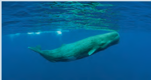
Potvissen zijn geen zeldzame gasten rondom de Azoren.

Van west naar oost lokken Flores, Corvo, Faial, Pico, São Jorge, Graciosa, Terceira, São Miguel en Santa Maria almaar meer natuurliefhebbers en hikkers, maar ook zeilers en waterportfanaten naar de lieflijke eilanden. Rust en stilte, een uitgesproken groen en gevarieerd landschap, en een vriendelijke bevolking staan garant voor een reis vol belevenissen. Toen het kleine Portugal aan de rand van Europa opklom tot een van de machtigste zeevaartnaties ter wereld, vormden de Azoren in 1427 – na Ceuta in 1415 en Madeira in 1418 – een van de eerste haltes van de Portugese uitbreiding. Ook nu nog behoren ze staatkundig tot Portugal. Net zoals Madeira verwierven ze na de Anjerrevolutie de status van autonome regio. Het parlement van de eilanden heeft beperkte financiële en bestuurlijke bevoegdheden. Tijdens de Twee-