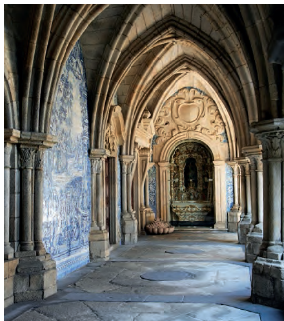
Foto boven: vanaf de overkant van de Douro heb je een prachtig uitzicht op de Ribeira en de allesoverheersende kathedraal. Het op een vesting lijkende godshuis bezit kruisgangen met fijne kunstwerken van azulejo's (foto rechts).

met een paar opzienbarende kunstgrepen: hij creëerde een stralend, met goud bedekt hoogaltaar onder een helder cassetteplafond van marmer en graniet en voorzag de sacramentskapel in de linkerdwarsbeuk van een nog fraaier altaar, dat tussen 1632 en 1732 door Manuel Teixeira, Manuel Guedes, Bartolomeus en andere Portugese kunstenaars van 800 kg zuiver zilver werd gemaakt.