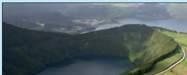
Sete Cidades In het noordwesten van het eiland São Miguel illustreren de mysterieuze kratermeren Sete Cidades de afmetingen van de reusachtige krater met zijn diameter van 12 km. Het mooiste uitzicht biedt de Vista do Rei, het 'panorama van de koning'.