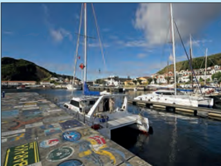
Horta Horta op het eiland Faial was altijd al een belangrijke tussenstop bij de oversteek van de Atlantische Oceaan. De karvelen van de vroegere ontdekkers zijn intussen vervangen door ranke zeilboten. Van overal zie je de Pico op het gelijknamige buureiland. Zeilers komen samen in Peter's Café Sport.