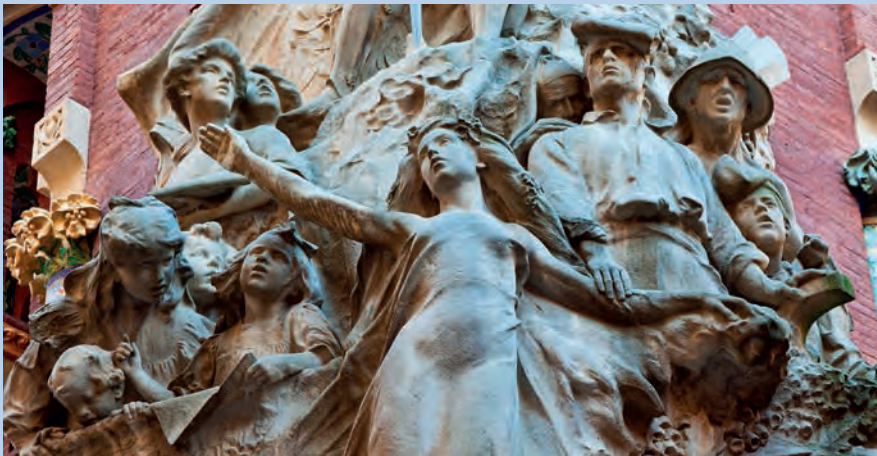
Architecturaal detail op de gevel van het Palau de la Música.

Het pronkstuk van de stad en meesterwerk van Antoni Gaudí: de tot op heden onvoltooide kerk La Sagrada Família met haar gigantische afmetingen en buitensporige, symbolische vormtaal. Andere werken van Gaudí: in de Barri Xines de grafelijke privéwoning Palau Güell, in de door modernisme gekenmerkte nieuwe wijk Eixample de huizen Casa Milà met zonderlinge versieringen en een