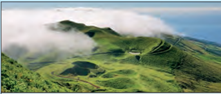
São Jorge Het 56 km lange eiland is het centrum van de Azoren. Bijzonder zijn de landtongen, de fajas die via wandelpaden te bereiken zijn. De eilandbewoners leven vooral van de veehouderij.