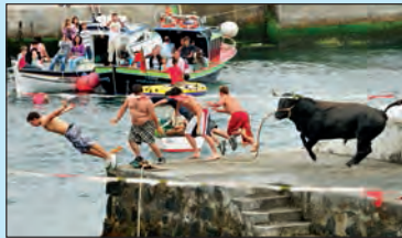
Terceira Het eiland werd als derde ontdekt en kwam zo aan zijn naam. Sinds de Tweede Wereldoorlog zijn er in Lajes een luchthaven en een Amerikaanse luchtmachtbasis. Het eiland is vooral bekend om zijn bijzondere stierengevechten en om Angra do Heroísmo.