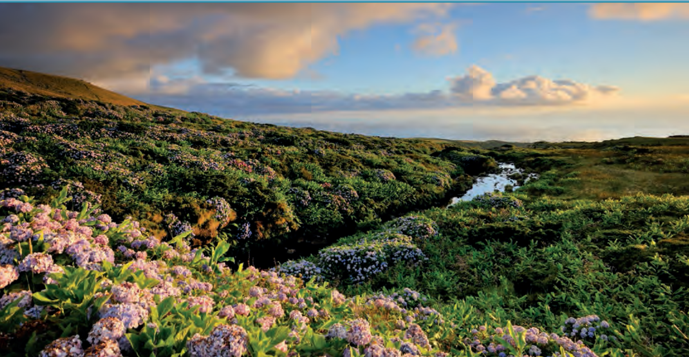
Groen en bloeiend zijn de Azoren op veel plaatsen, zoals hier op Flores.

enkele onbewoonde eilanden liggen verspreid over een afstand van 650 km. Lokale vluchten en vooral veerboten zorgen voor de verbinding tussen eilanden. Het loont de moeite om alle eilanden te verkennen.