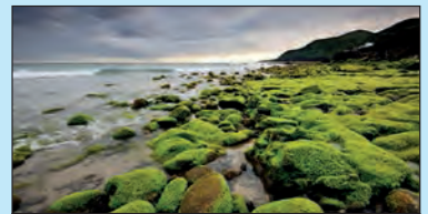
Santa Maria Het eiland werd als eerste van de Azoren in 1427 betreden door Portugezen. Vanuit geologisch oogpunt is dit het oudste eiland van de archipel.