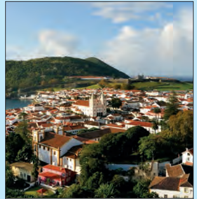
Angra do Heroísmo De hoofdstad van Terceira heeft altijd al een belangrijke rol gespeeld. De stadskern werd in de 17de en 18de eeuw gebouwd, net zoals het stadhuis en de kerken. De kathedraal Sê dateert van 1568. Na een aardbeving op nieuwjaarsdag 1980 werd de stad herbouwd.