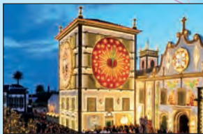
São Miguel Het hoofdeiland van de Azoren is het ideale vertrekpunt voor een rondreis en heeft een landschap met uitgesproken vulkanische kenmerken, weiden en weelderige hortensiahagen. De hoofdstad Ponta Delgada is rijk aan geschiedenis.