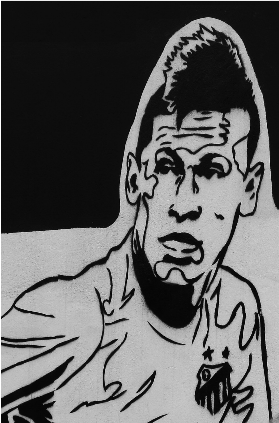
Neymar, als onderdeel van een serie kunstzinnige muurschilderijen aan het oefencomplex van Santos fc