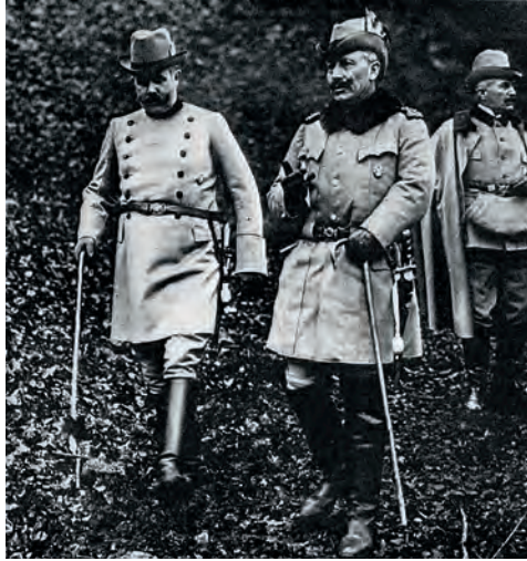
Na de aanslag op aartshertog Frans Ferdinand (links) verklaart Oostenrijk-Hongarije aan Servië de oorlog met steun van het Duitse keizerrijk van Wilhelm II (rechts)

maar kwamen daarbij in elkaars vaarwater. Uiteindelijk werden zowel het Oostenrijks-Hongaarse keizerrijk als het Ottomaanse rijk bondgenoten van het Duitse rijk en werd Servië een bondgenoot van Rusland.