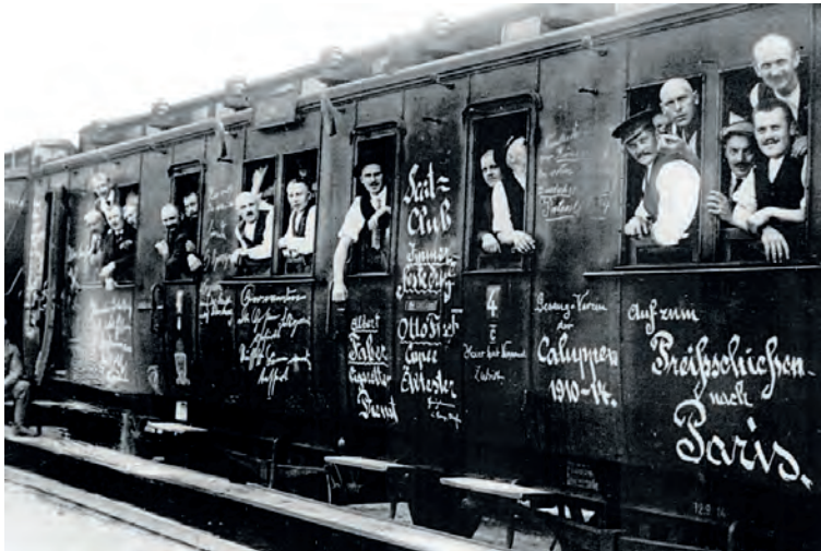
'A Berlin', 'Nach Paris': het enthousiasme voor de nieuwe oorlog is aanvankelijk groot en velen denken ook dat die net zoals in 1870 van korte duur zal zijn