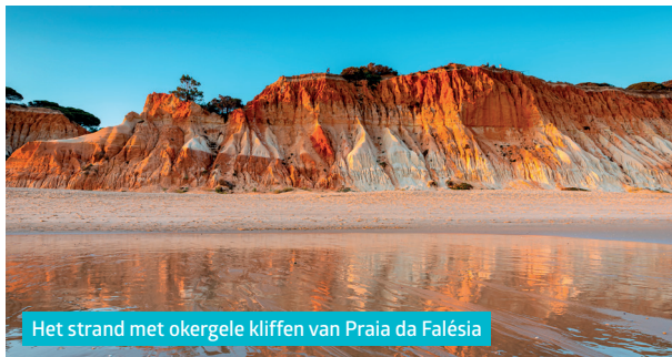
Het strand met okergele kliffen van Praia da Falésia