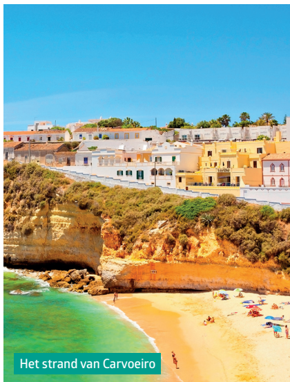
Het strand van Carvoeiro

Excursie: Querença en Fonte da Benémola 98