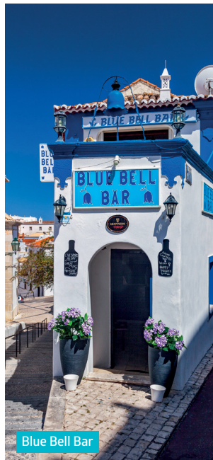
Blue Bell Bar