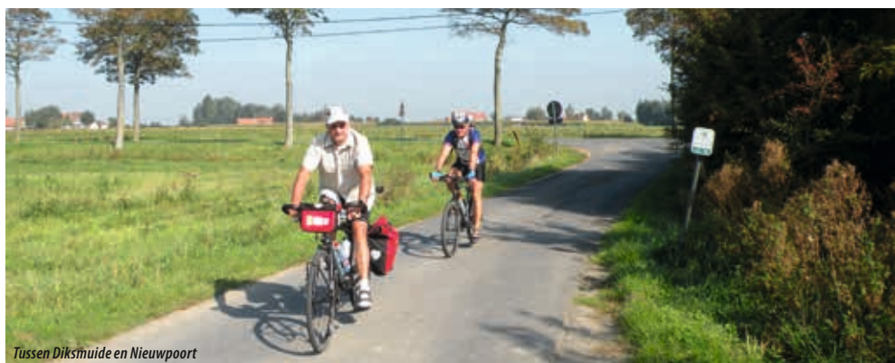
Tussen Diksmuide en Nieuwpoort