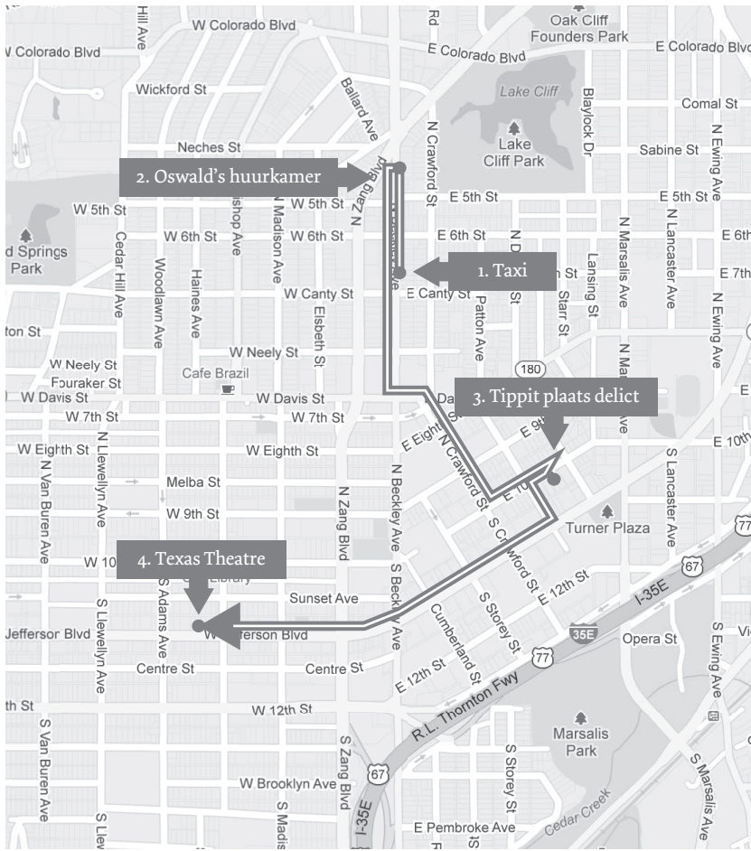
Figuur 2. De route van Oswalds pension naar de plaats van de moord op agent Tippit en vandaar naar het Texas Theatre. Kon Oswald voor 13.15 uur op de plaats zijn waar Tippit werd vermoord?

Van zijn huurkamer naar East Tenth Street 410, waar de patrouillewagen van politieagent Tippit zich bevond, was het 1320 meter lopen (0,88 mijl). Getuigen zagen de agent door het open raam aan de passagierszijde een gesprek voeren met zijn toekomstige moordenaar. Toen Tippit uit de wagen stapte, maakte de man hem genadeloos af met vier pistoolschoten. Tippits dienstwapen werd daarna onder zijn lichaam gevonden. Vermoedelijk had hij bij het uitstappen zijn holster geopend en misschien naar zijn wapen gegrepen. Tijdens zijn vlucht verwijderde de moordenaar de lege hulzen uit zijn pistool en gooide ze weg.