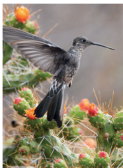
↑ De grootste kolibri ter wereld is te vinden in Peru.