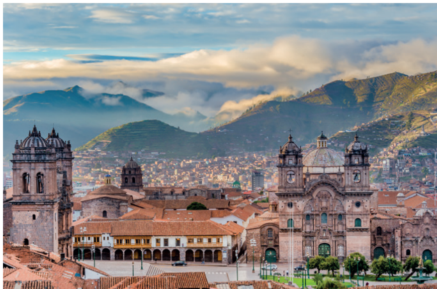
↑ Plaza de Armas is een van de mooiste koloniale pleinen van Peru.

‘Tijdens een driedaagse trektocht in het Parque Nacional Natural Los Nevados, diep verscholen in de Colombiaanse Andes, start je onder de hoogste palmbomen ter wereld, doorkruis je het mistige nevelwoud en wandel je via de páramo – een zone tussen de boom- en sneeuwrens – verder tot aan de voet van besneeuwde vulkanen. De beklimming van de Paramillo del Quindio is pittig, maar het vergezicht vanaf de top geeft je een onoverwinnelijk gevoel.’