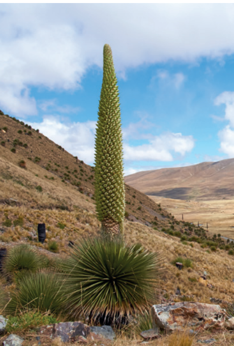
↓ De Puya's Raimondii danken hun naam aan de Italiaanse natuuronderzoeker Antonio Raimondi.