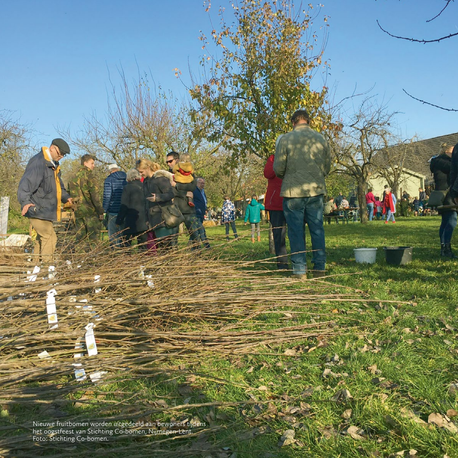
Nieuwe fruitbomen worden uitgedeeld aan bewoners tijdens het oogstfeest van Stichting Co-bomen, Nijmegen-Lent.