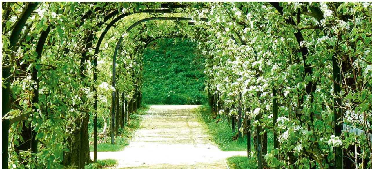
De Ursulinentuin of Bezinningstuin is een oude kloostertuin in het centrum van Sittard.