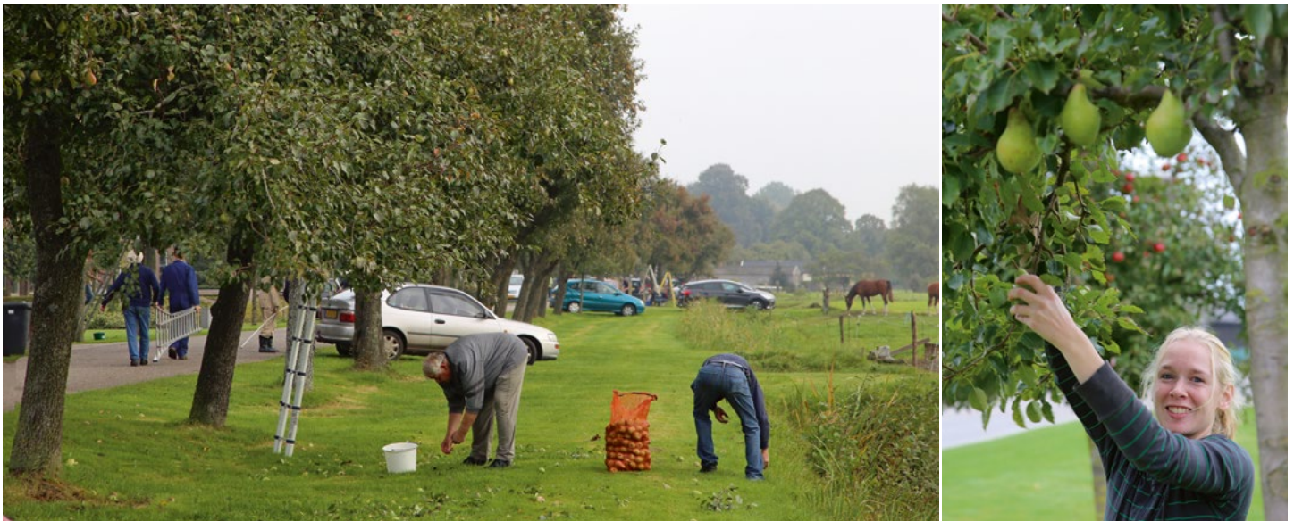
De Perenpluk in Ruinerwold (Drenthe).