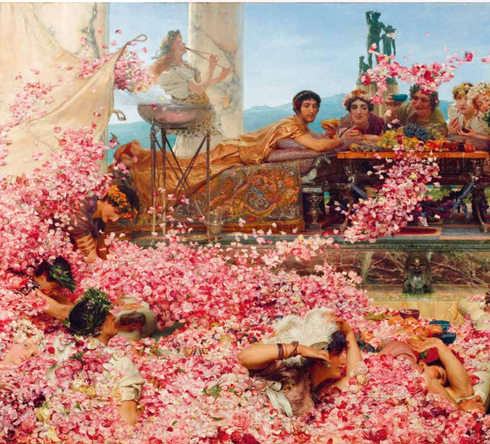
LOURENS ALMA TADEMA DE ROZEN VAN HELIOGABALUS (1888)