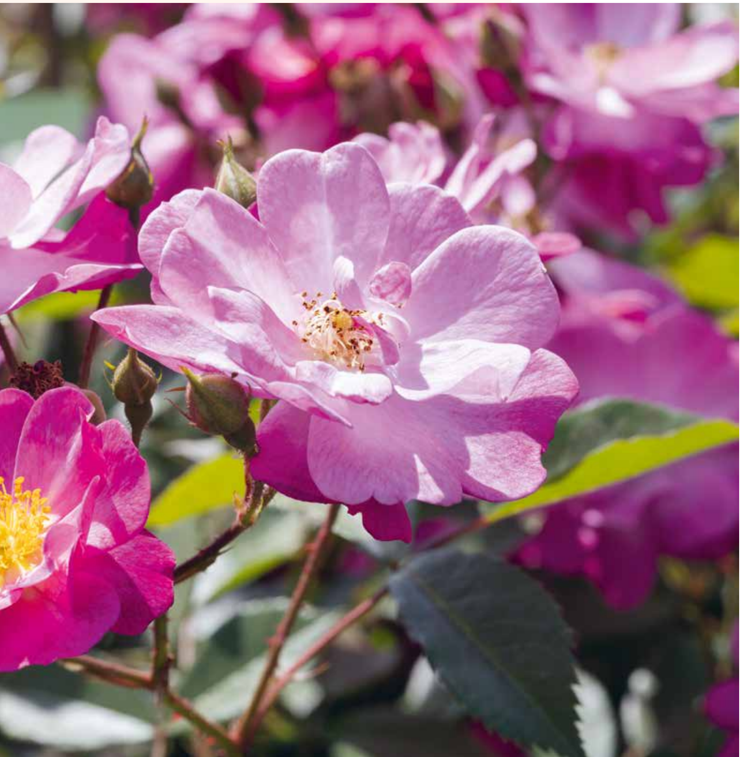
ROSA 'LAVENDER DREAM'