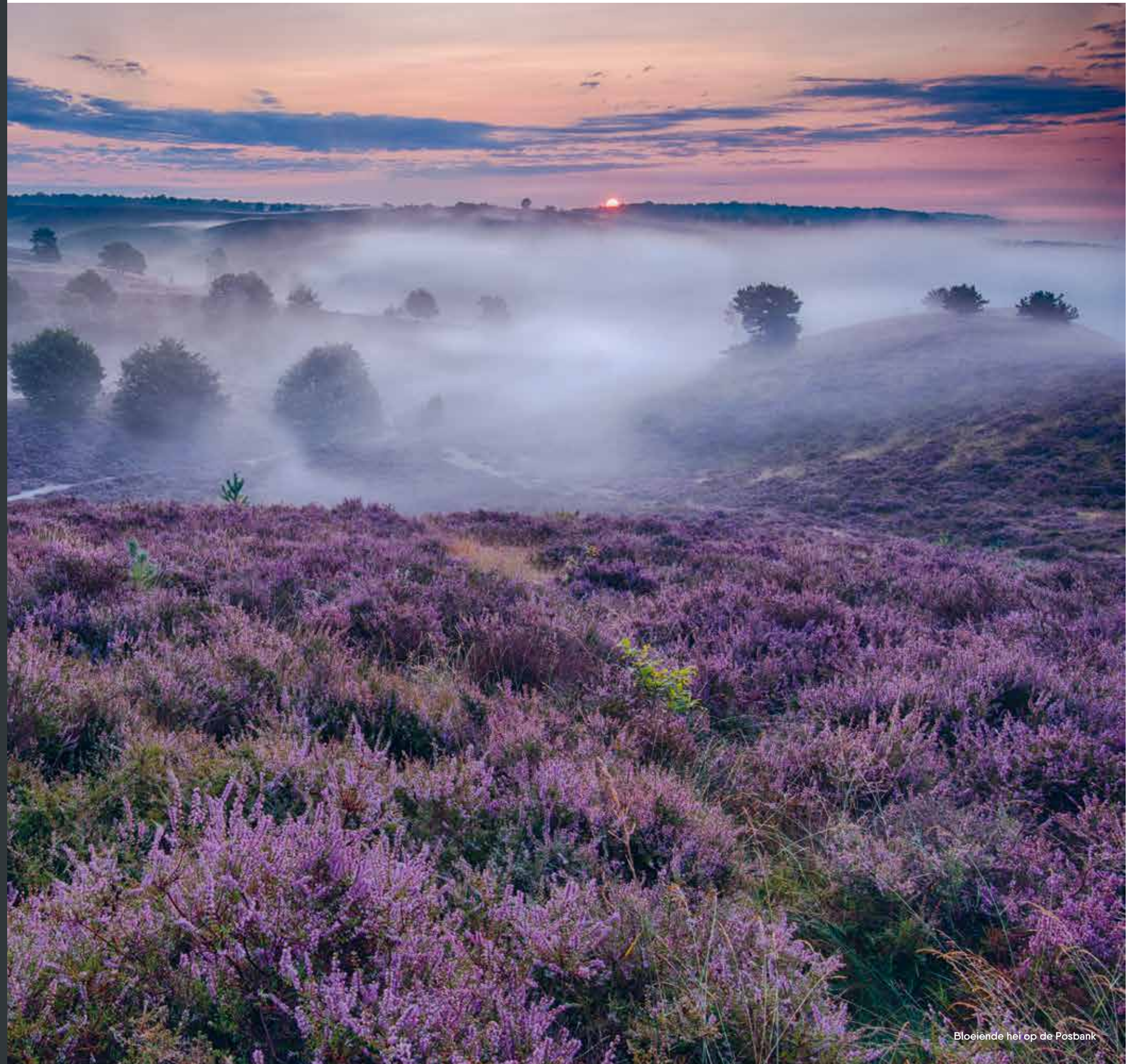
Bloeiende hei op de Posbank