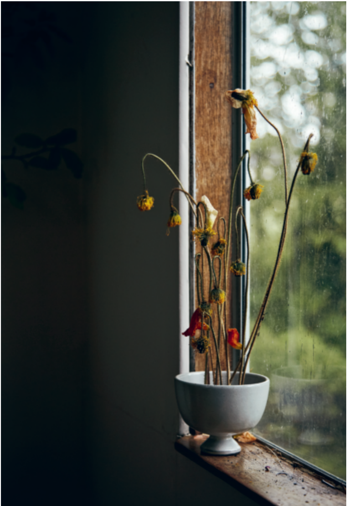
Altijd in bloei