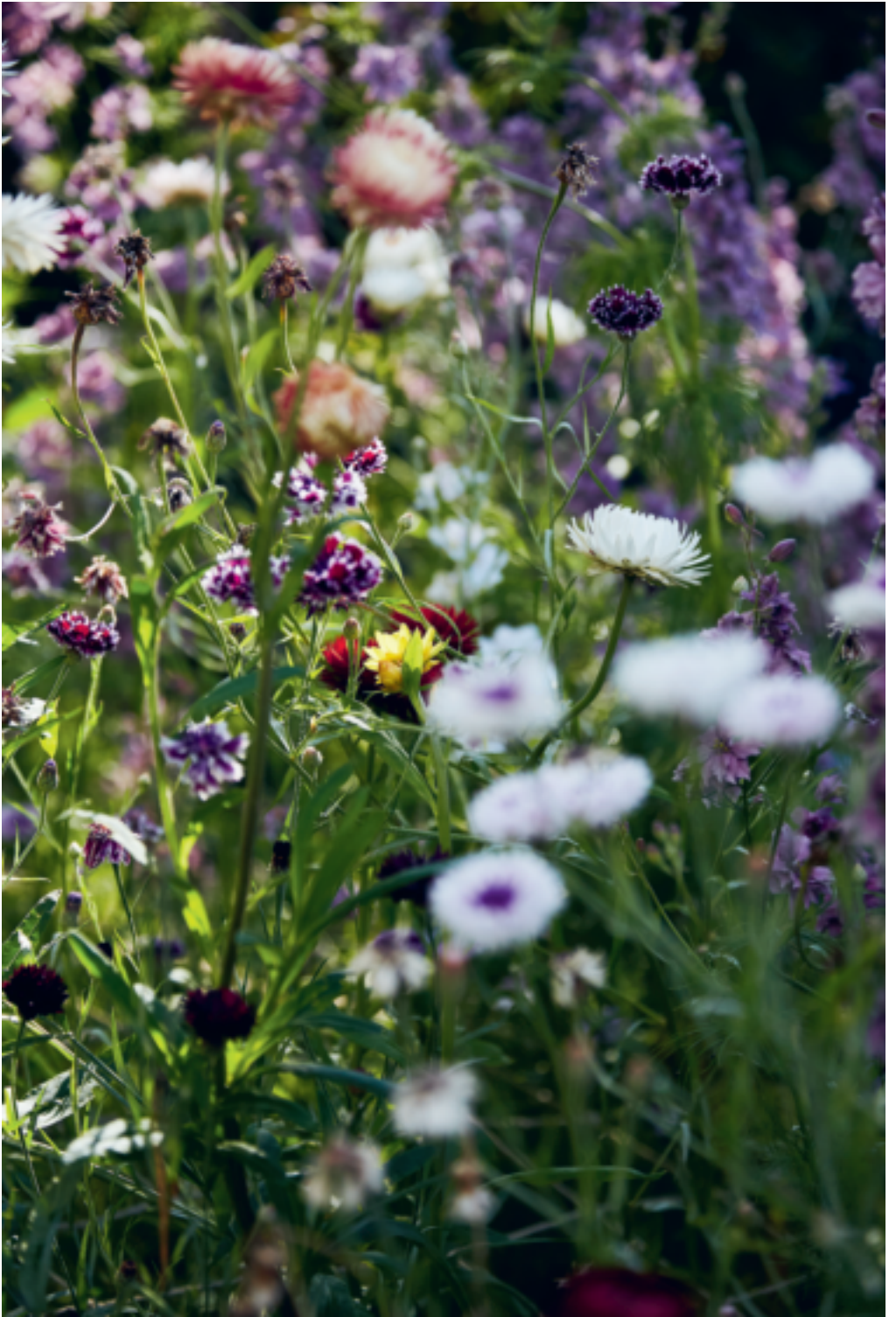
VARIËTEIT: Centaurea cyanus 'Classic Magic' en witte en gele strobloemen ( Helichrysum bracteatum )