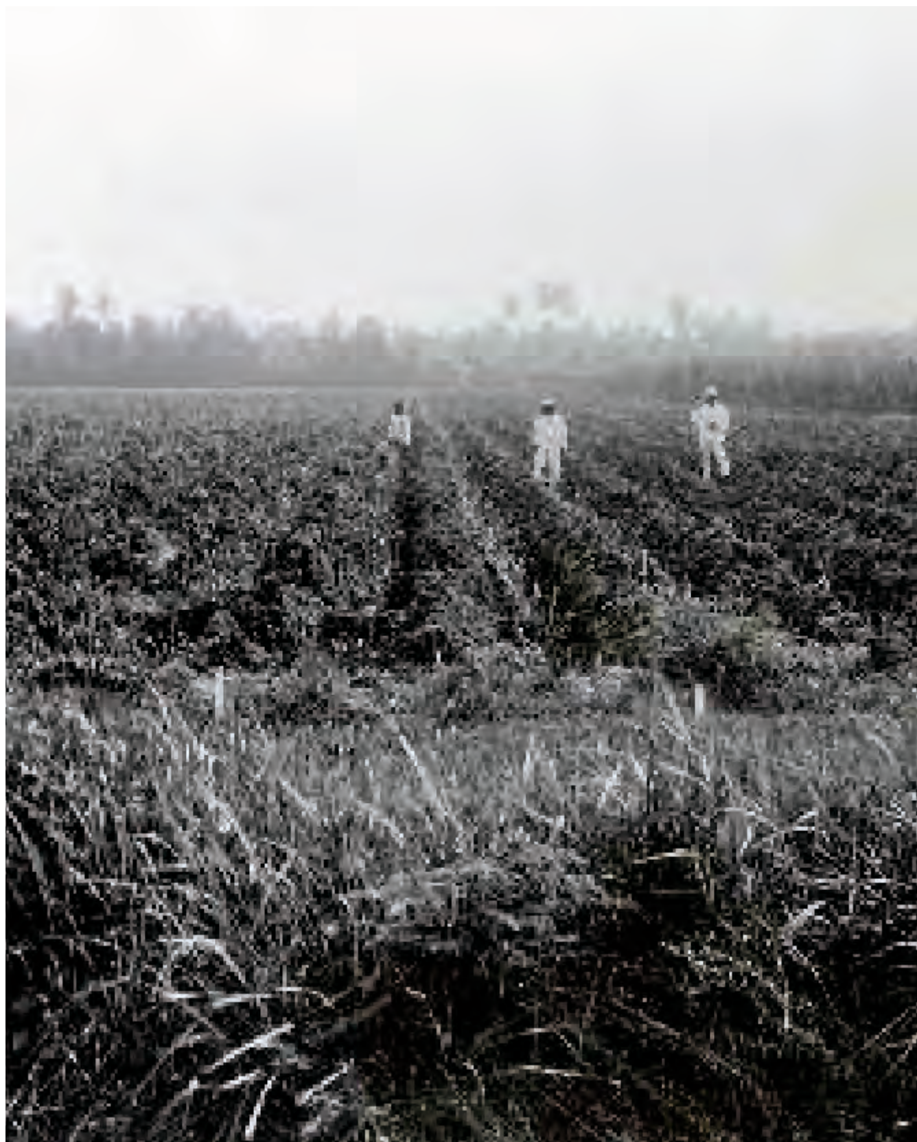
Rietvelden rond suikerfabriek Pening, 1912.