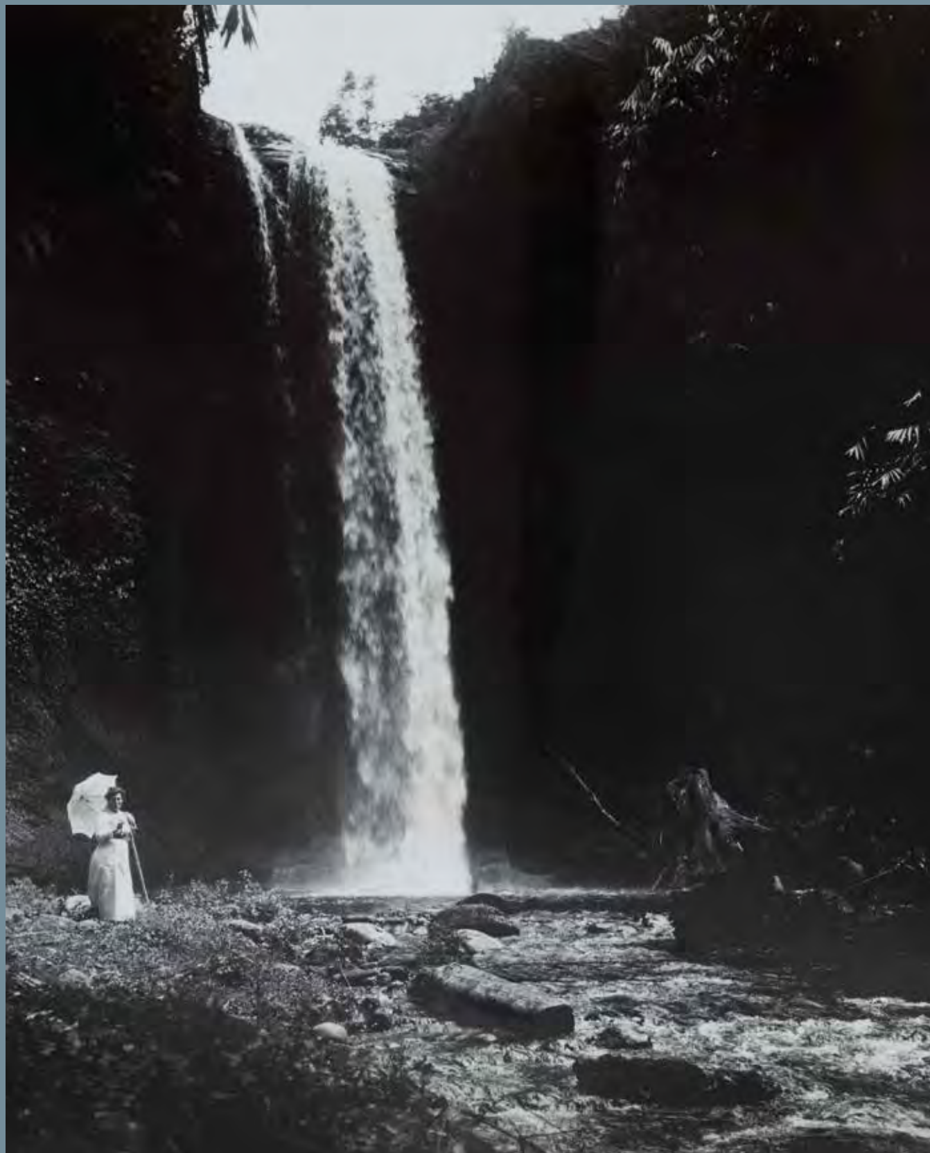
Bertha bij een waterval nabij Nongkodjadjar, Pasoeroean, Oost-Java 1911.