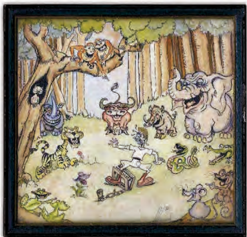
De avonturen van Jan. Cartoon van Sam, 1932.

De emoties van mijn vader waren maar al te begrijpelijk.