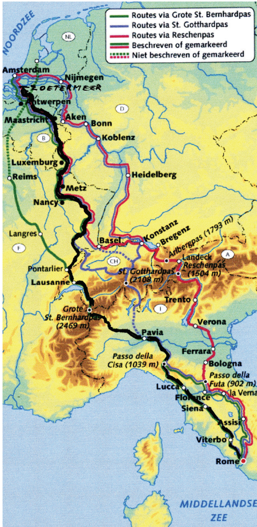
Onze route via Pelgrimspad, GR5 en Via Francigena

kunnen veroveren en overheersen, stamt de toenmalige waarheid en nog steeds bestaande uitdrukking “alle wegen leiden naar Rome”.