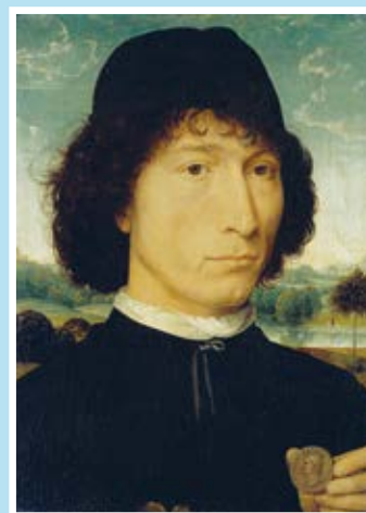
HANS MEMLING, MAN MET ROMEINSE MUNT, ROND 1480 KMSK, ANTWERPEN