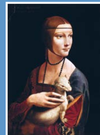
LEONARDO DA VINCI, DE DAME MET DE HERMELIJN, 1490 CZARTORYSKI MUSEUM, KRAKAU

Natuurlijk ken je Leonardo's wereldberoemde MONA LISA... Maar Leo schilderde ook dit mooie, mysterieuze meisje. Het is Cecilia Gallerani. Cecilia was een van de vele liefjes van hertog Sforza. De hertog was een fan van LEONARDO DA VINCI en bestelde het schilderijtje. Eerst schilderde Leo het meisje zonder diertje. Hij was niet tevreden, want hij schilderde er in een tweede laagje een soort grijs wezeltje bij. Ook nu was Leonardo niet helemaal blij met het resultaat en hij veranderde het wezeltje - in een derde laag - in een soort WITTE HERMELIJN. (Zo zie je maar dat een superkunstenaar als Leonardo ook soms een paar keer moest proberen voor hij zijn tekening perfect vond... Blijven proberen dus.) Sommige mensen denken dat de hermelijn een ideetje was van Cecilia zelf. 'Hermelijn' was de bijnaam van hertog Sforza. Met een hermelijntje in haar armen kon iedereen zien dat CECILIA en de hertog verliefd waren op elkaar.