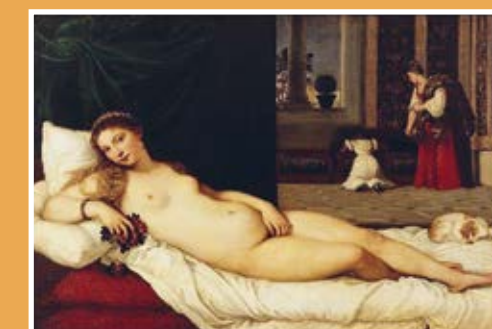
TITIAAN, VENUS VAN URBINO, 1538