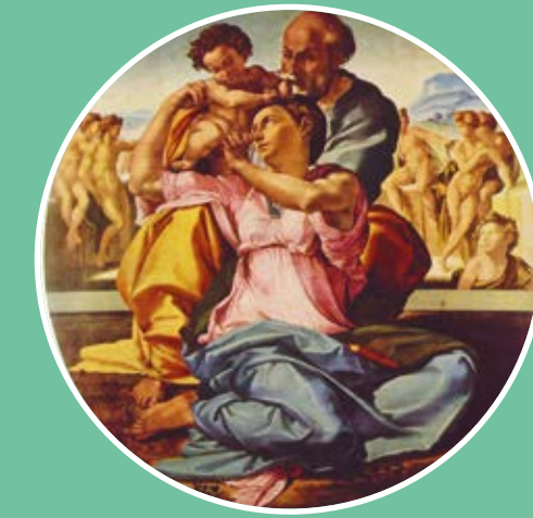
MICHELANGELO, TONDO DONI, 1504 UFFIZI, FIRENZE

Michelangelo was een geniale kunstenaar die gebouwen ontwierp, standbeelden kapte uit grote blokken steen en gigantische muurschilderingen maakte. Zijn allerberoemdste kunstwerk is het reuzegrote schilderij op het plafond van het paleis van de paus. Maar heel af en toe maakte hij ook een zeldzaam 'los' schilderij.