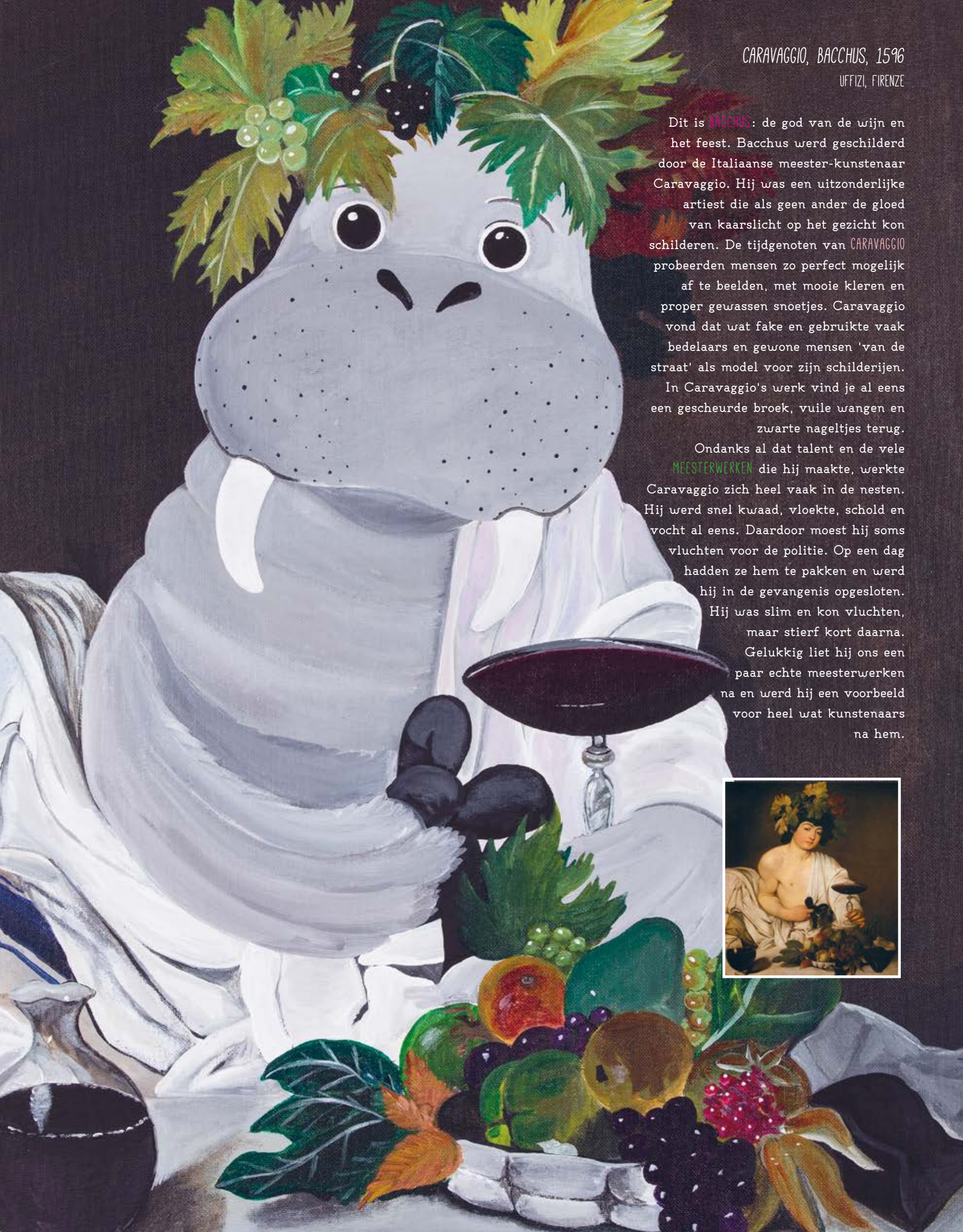
CARAVAGGIO, BACCHUS, 1596 UFFIZI, FIRENZE

Dit is BACCHUS : de god van de wijn en het feest. Bacchus werd geschilderd door de Italiaanse meester-kunstenaar Caravaggio. Hij was een uitzonderlijke artiest die als geen ander de gloed van kaarslicht op het gezicht kon schilderen. De tijdgenoten van CARAVAGGIO probeerden mensen zo perfect mogelijk af te beelden, met mooie kleren en proper gewassen snoetjes. Caravaggio vond dat wat fake en gebruikte vaak bedelaars en gewone mensen 'van de straat' als model voor zijn schilderijen.