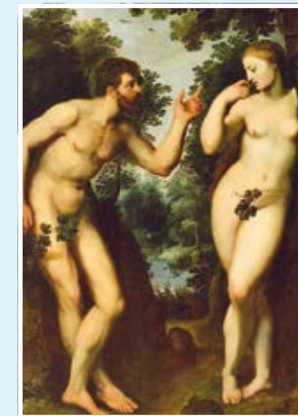
PETER PAUL RUBENS, ADAM EN EVA, 1598-1600 RUBENSHUIS, ANTWERPEN

Ook geniale schilders als RUBENS moesten eerst alle kneepjes van het vak leren bij een meester. Rubens' meester was Otto van Veen. Na een paar jaartjes schoollopen bij Otto vond Rubens het welletjes. Hij was klaar om zelf ' KUNSTSCHILDER ' te worden. Dit Adam en Eva-schilderij is een van de eerste schilderijen die Rubens na zijn schooltijd schilderde. Je kan er nog wel een beetje Otto's stijl in herkennen. Maar heel wat kenners vinden dat Rubens zelfs toen al beter was geworden dan zijn meester. Zoveel talent had hij! Hij schilderde het verhaal van ADAM EN EVA later nog een paar keer. Heel veel kunstenaars vonden dat trouwens een prachtig onderwerp. Het verhaal komt uit het eerste hoofdstuk van de Bijbel. Het gaat zo: God - de bedenker en maker van de wereld - blies in een hoopje zand en floep, daar was Adam. De allereerste mens! Toen nam hij een stukje van Adam en boetseerde daar Eva mee. Adam en Eva kregen een prachtig paradijs vol bloemen en sappig fruit. En ze gingen nooit dood. Maar er was wel één huisregel. Ze mochten niet eten van de appels van de boom van ' GOED & KWAAD '. Je raadt het natuurlijk al. Stoute slang vertelde aan Eva dat net die appels de allerlekkerste waren van de hele tuin. Eva proefde en gaf dan de appel door aan Adam, die zich ook niet kon inhouden. Toen God het hoorde, werd hij razend. Hij zette Adam en Eva uit het paradijs en nam hun onsterfelijkheid af. Jammer hé?