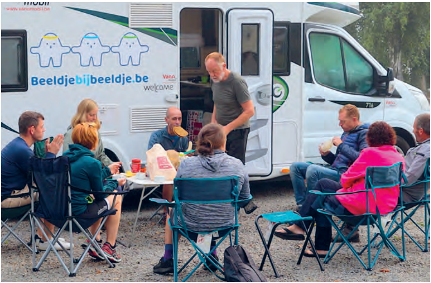
Ontbijt op de camping met veel gezelschap.