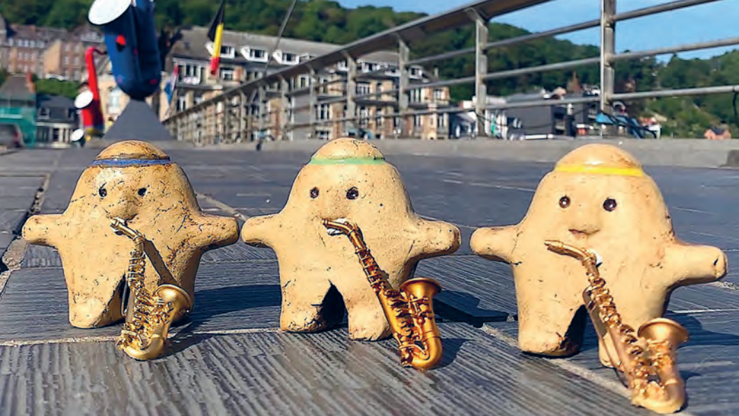
De beeldjes met saxofoon in Dinant.