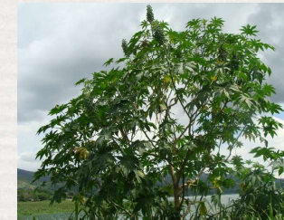
Deze boom is vernoemd naar de wonderboom van Jona.

10 Toen zei de Heer: 'Jij wilde niet dat die ene plant doodging. Die plant groeide vanzelf, daar hoefde jij niets voor te doen. Hij groeide in één nacht, en in één nacht ging hij dood. Maar jij wilde dat die plant bleef leven! 11 Begrijp je dan niet dat ik wilde dat de mensen in Nineve zouden blijven leven? In die stad wonen meer dan 120.000 mensen. Ze weten niet wat goed is en wat slecht is. En in Nineve zijn ook nog heel veel dieren. Ik wilde niet dat al die mensen en dieren zouden sterven.'