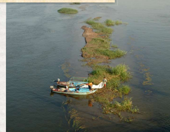
De Nijl was en is erg belangrijk voor de Egyptenaren.