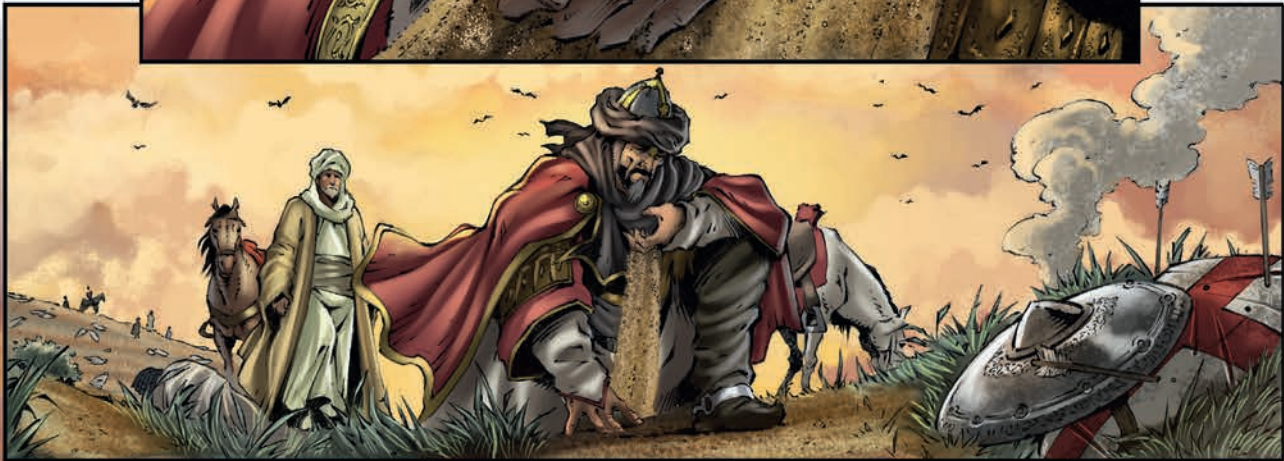
DE HORENS VAN HATTIN. 1187.

HEER, NU HEEFT U EINDELIJK DE DEFINITIEVE OVERWINNING WAAR U ZO VUURIG NAAR VERLANGDE. DE BELANGRIJKSTE!