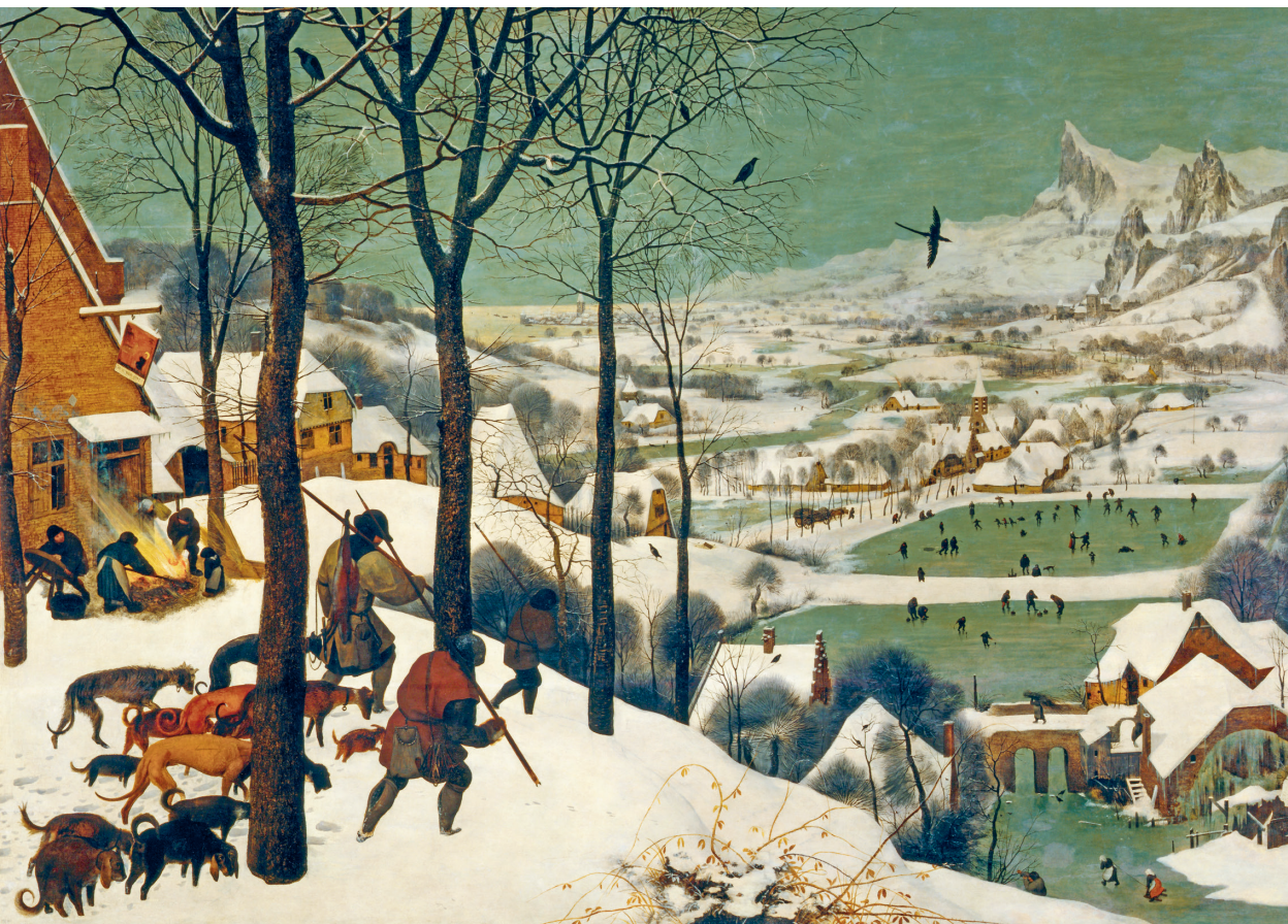
Jagers in de sneeuw, door Pieter Bruegel de Oude. Olieverf op paneel, 1565; coll. Kunsthistorisches Museum Wien.

Jagersvereniging legt zich daar vooralsnog bij neer, maar waarschuwt voor ‘onbeheerbare populaties’. 15 Dit standpunt sluit aan bij de trend onder jagers om zich nadrukkelijker als natuurbeheerder te presenteren, wiens doel niet is een soort uit te roeien maar een gezonde wildpopulatie te bevorderen: niet te veel en niet te weinig.