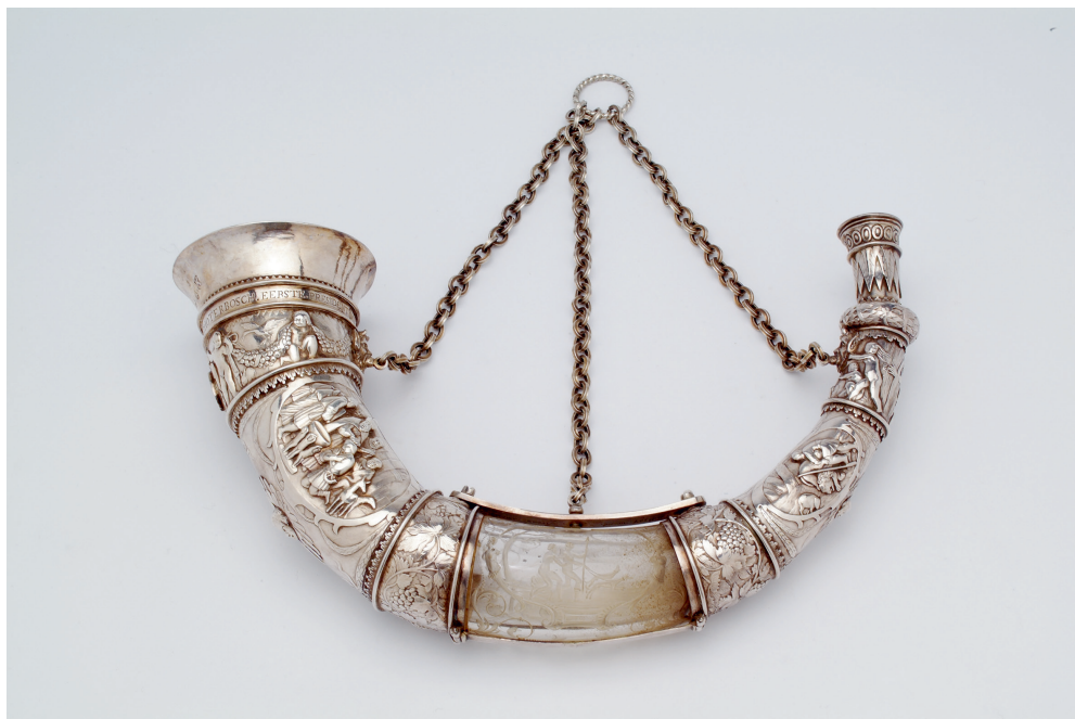
Drinkhoorn van het Loffelijke gilde van Sint Hubert te Haarlem, vervaardigd door Arent Lambertz Versteegge naar een ontwerp van Salomon de Bray, 1630. Coll. Frans Halsmuseum, Haarlem; foto Tom Haartsen.

laten jagen. Voor de adel was de jacht een surrogaat voor oorlog. Door te jagen konden jonge edelen ervaring opdoen in krijgsvaardigheden als paardrijden en boogschieten en leerden zij omgaan met de dood. Ook nadat ontwikkelingen op krijgsgedebied het belang van jagen als leerschool voor oorlogsvoering minder belangrijk hadden gemaakt, bleef voor de adel de jacht symbool staan voor het slagveld. 30