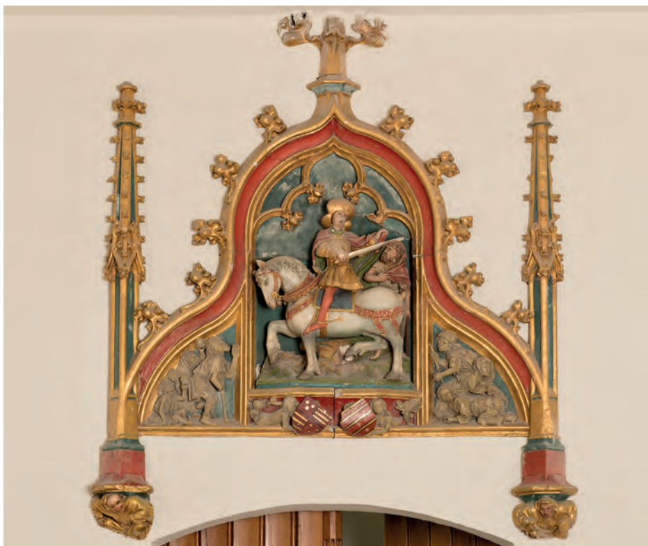
Sint-Maarten. Dessus de Porte (deurstuk) dat oorspronkelijk boven de keukendeur van het Zoudenbalchhuis aan de Donkerstraat was geplaatst. In 1875 werd het overgebracht naar het Hiëronymushuis aan de Maliesingel en boven de kapeldeur bevestigd. Foto Carel de Wilde 2016

daille. Nergens staat het pregnanter dan in de eerste Johannesbrief: ‘Wie zijn broeder die hij ziet, niet liefheeft kan onmogelijk God liefhebben, die hij nooit heeft gezien’ (1 Joh. 4,20). De reflectie op de eenheid van de beide geboden, ‘waaraan heel de Wet en de profeten hangen’, is in de geschiedenis van de Kerk en vooral in de beoefening van de caritas onophoudelijk doorgegaan. Ze is dan ook van fundamentele betekenis.