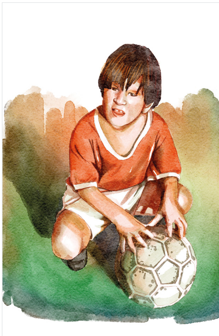
Schilderij van Messi met zijn voetbal als hij 5 jaar is.