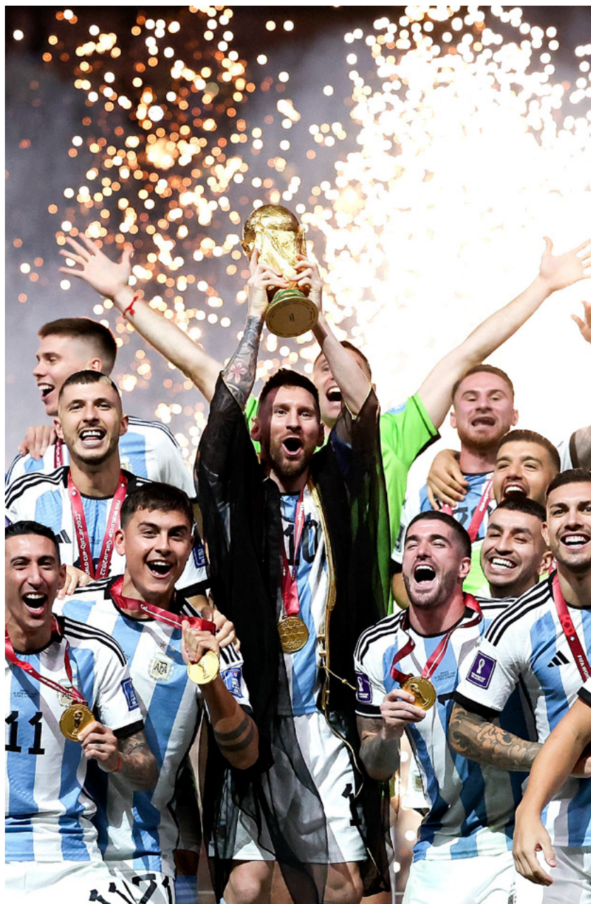
18 december 2022 - Messi en zijn team vieren de overwinning in het stadion in Qatar.