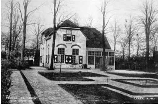
Pension De Linden aan de Paviljoensweg, Laren