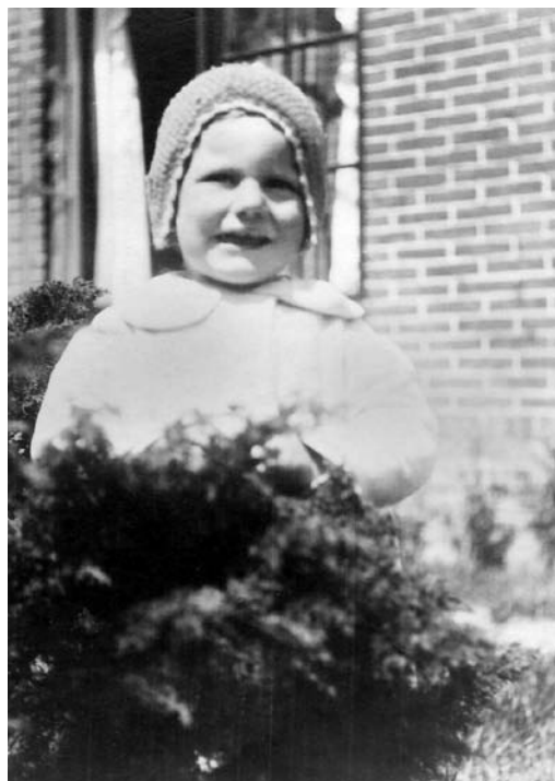
Simeon ten Holt, circa 1925