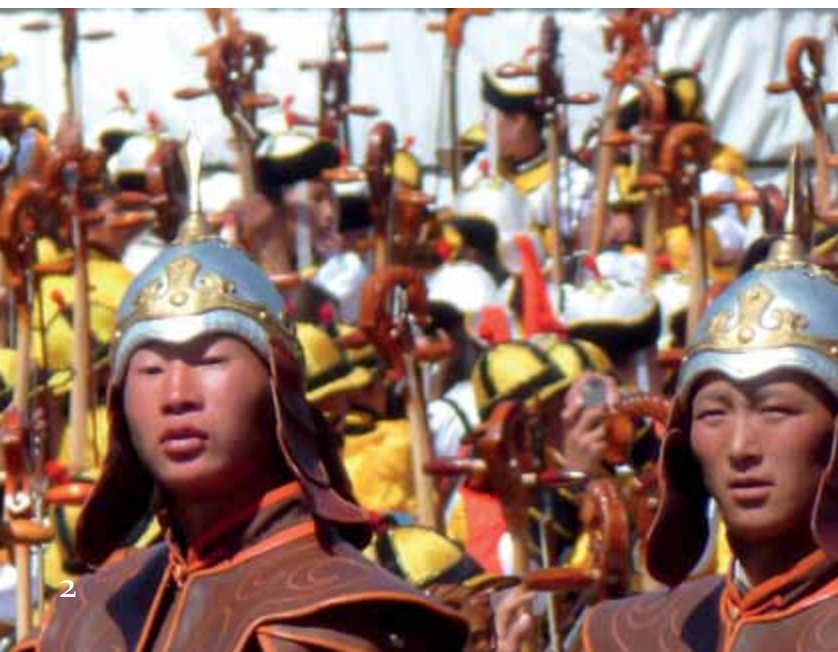
1 Binnenzicht ger 2 Nadaamfestival