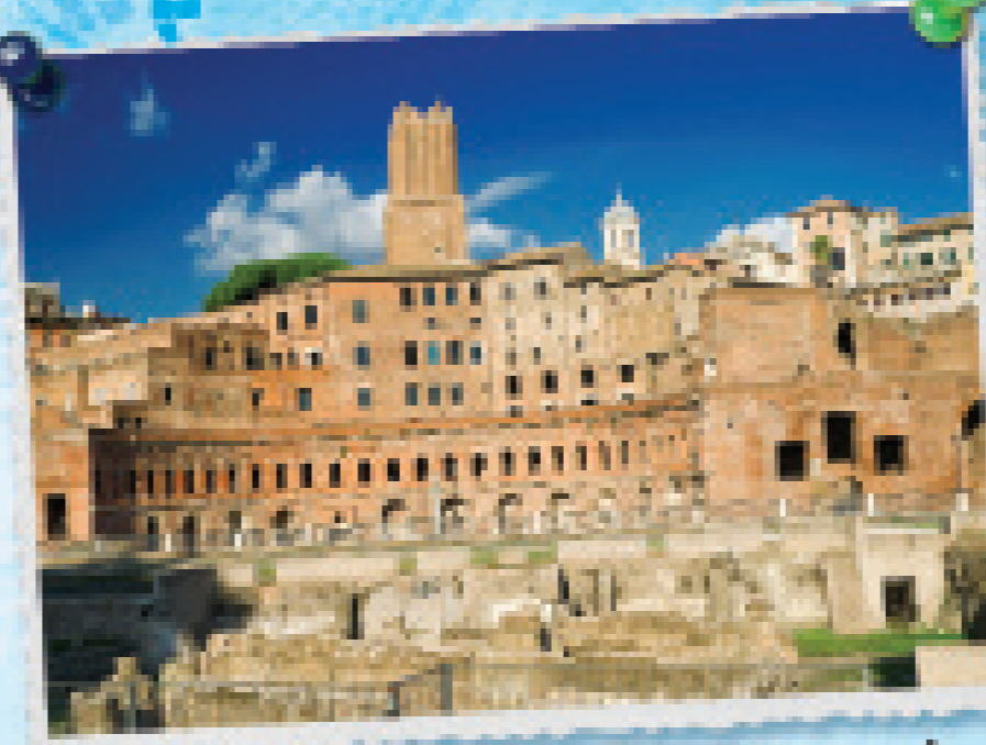
Het Forum van keizer Trajanus in Rome was groter dan twee voetbalvelden. Het forum was het belangrijkste plein van de stad.

Het kleine staatje Rome viel in de 3e eeuw v. Chr. voor het eerst een ander gebied aan: Sicilië. Dat is het grootste eiland in de Middellandse Zee. Dankzij zijn sterke en machtige leger veroverde Rome in 350 jaar elke staat waar zijn blik op viel. Op het hoogtepunt besloeg het Romeinse Rijk het grootste deel van Europa en Noord-Afrika. In Nederland liep de noordelijke grens van het Rijk, de Limes, langs de rivier de Rijn. Het Romeinse Rijk besloeg in totaal zo'n 6,5 miljoen vierkante kilometer!