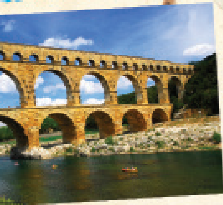
Het aquaduct Pont du Gard in Frankrijk is 275 meter lang en bijna 50 meter hoog.

De Romeinen waren supergoede bouwers. Ze bouwden graag met sterk beton en waren dol op bogen. Veel van hun bouwwerken staan nog steeds overeind. Zoals bruggen, aquaducten en het Pantheon in Rome. Al hun steden en dorpen waren met elkaar verbonden via goede, rechte wegen. Bij elkaar waren die zo'n 400.000 kilometer lang. De bekendste is de Via Appia. Die loopt van Rome naar Brindisi in de hak van de laars.