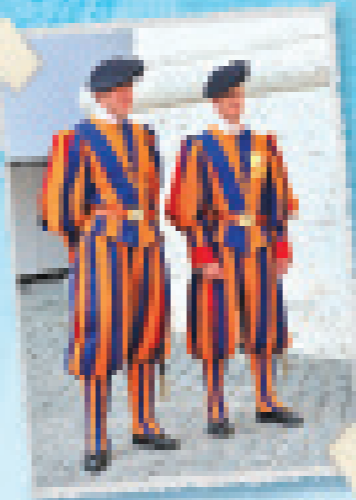
De Zwitserse Garde bewaakt het Vaticaan sinds 1500.

De Trevifontein stelt de zee voor met de zeegod Oceanus.