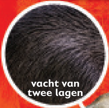
vacht van twee lagen