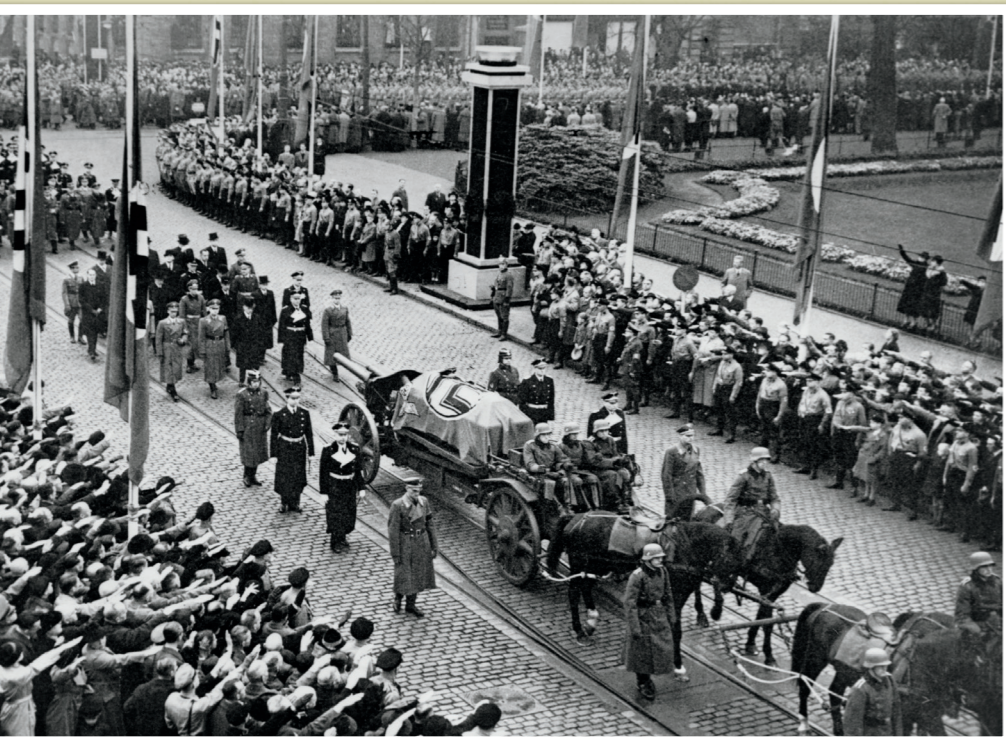
● Hitler was bij de begrafenis van Ernst vom Rath in Düsseldorf, Duitsland.

Op 7 november werd Ernst vom Rath, een medewerker van de Duitse regering, neergeschoten in Parijs. Hij overleed twee dagen later. De dader was de Poolse-Joodse tiener Herschel Grynszpan. Hij was kwaad, omdat Poolse Joden die in Duitsland woonden door de nazi's het land waren uitgezet. Onder hen waren zijn ouders, broer en zus. Ze hadden hun huis en al hun bezittingen moeten achterlaten.