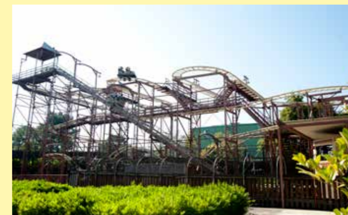
de Speedy Bob, een wildemuis-achtbaan in Bobbejaanland, Lichtaart, België.

De vierdimensionale achtbaan Eejanaika in Fujiyoshida, Japan, laat de passagiers wel veertien keer over de kop gaan! Het gaat om twee loopings en twaalf rotaties van de stoeltjes.