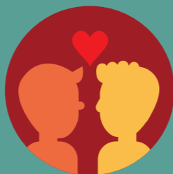
Seks hebben op verschillende manieren