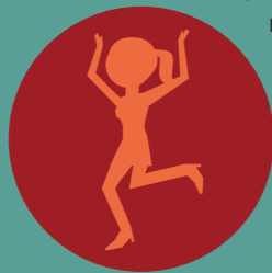
Uit de kast komen