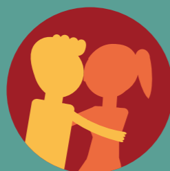
Seks hebben, of ervoor kiezen dat niet te doen