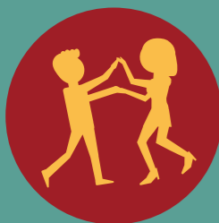
Een vriend of vriendin hebben

Ook als het over seks en relaties gaat, neem je je eigen beslissingen. Jij bepaalt zelf wat je wilt doen, en met wie.