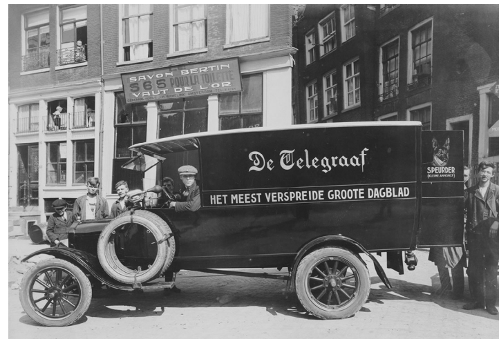
'Het meest verspreide groote dagblad' moest het afleggen tegen het veel goedkopere kopblad De Courant/Het Nieuws van den Dag.

'Ontvang de Duitse troepen kalm en waardig. Ook de overwonnene kan fier zijn,' adviseerde het dagblad op 15 mei 1940 na de invasie. Tot tientallen jaren nadat het finale kanonschot het einde van de oorlog had ingeluid, zou De Telegraaf worden herinnerd aan het pijnlijke hoofdredactionele 'ter overdenking' dat ze op 17 mei 1942 op last van de bezetter afdruckte: 'Begin Mei is ook in Nederland voor