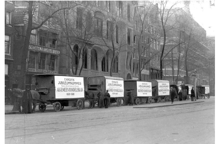
Vrachtkoetsen staan klaar om het jubileumnummer van het Algemeen Handelsblad te vervoeren.