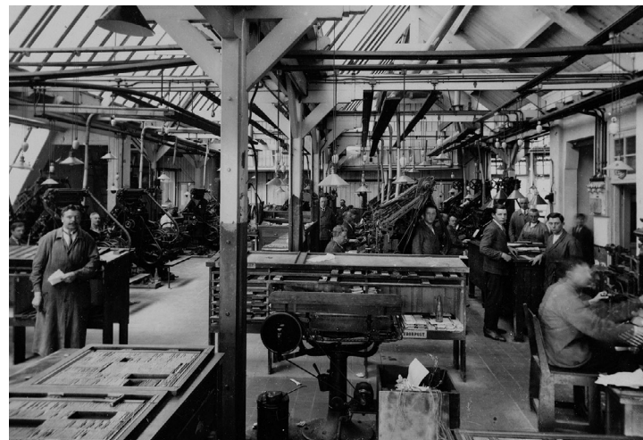
De zetterij en opmaak van het Algemeen Handelsblad, begin vorige eeuw.

De verschijning van het eerste nummer van het Algemeen Handelsblad, zaterdag 5 januari 1828, was in meer dan één opzicht een mijlpaal in de geschiedenis van de Nederlandse pers. Kranten fungeerden tot dan toe als roepstoeters van het politieke, maatschappelijke of religieuze gelijk, maar het Handelsblad had het lef om als eerste ongebonden landelijk dagblad een onafhankelijk geluid te laten