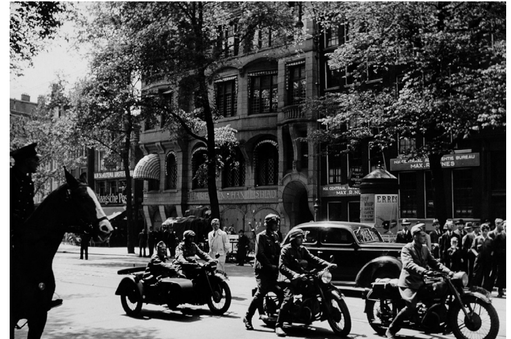
Nederlandse (vooraan) en Duitse militairen rijden op de Nieuwezijds, ter hoogte van het Handelsbladgebouw, mei 1940.

De schrijvers van Vóór de persen draaien gunden hun lezers een kijkje achter de schermen van de hectiek aan de Nieuwezijds. Zoals op de zetterij: 'De machines ratelen in een koor van metalen stemmen; als de grijpparmen van vreemd-gevormde monsters bewegen de hefboomen. Mannen brengen tientallen regels versch-gezet lood, in vasten greep geklemd, naar de correctietafels waar getrainde oogen bliksemsnel over de nog natte proeven vliegen. (...) Tientallen menschen loopen dooreen, praten, schreeuwen... Maar in dezen schijnbaren chaos kent ieder zijn taak tot in onderdeelen, elk radertje van deze gecompliceerde machine draait mee en heeft zijn betekenis. Het is het rijk van de Letter, zooals de redactie het rijk van den inhoud is. Zak dan met de lift omlaag. Open een deur, nog een... Een donderend geraas vervult de lucht, doet den bezoeker terugdeinzen,