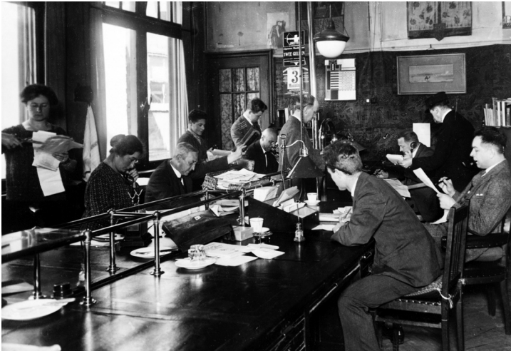
Redactie van het Handelsblad, 1925. Men schrijft de artikelen met pen en inkt, hoewel de typemachine al geruime tijd bestond.