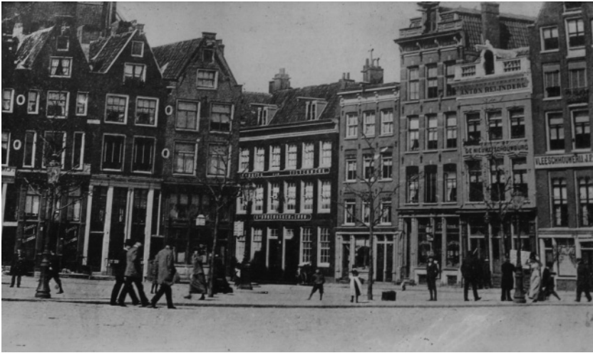
Leidseplein met Reynders - De Nieuwe Schouwburg begin 20ste eeuw

kwam ik in de bar terecht. Wist ik veel. Wat wilt u hebben? Vroeg de ober. Toen ik een kop soep bestelde, viel er een stilte. Ik kreeg een knalrode kop, heb betaald en ben als een gek weer weggegaan. [...]