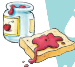
toast met zelfgemaakte jam