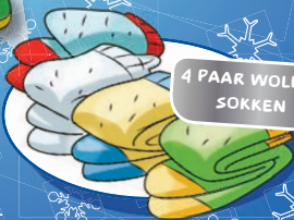
4 PAAR WOLLEN SOKKEN