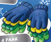
4 PAAR WANTEN