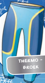
THERMO - BROEK