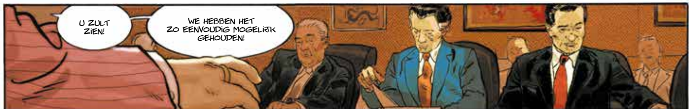
PALEIS VAN DE VOLKSVERGADERING - PEKING.

IK STEL VOOR DAT WE BEGINNEN MET HET ONTDEKKEN VAN ONZE AGENDA.