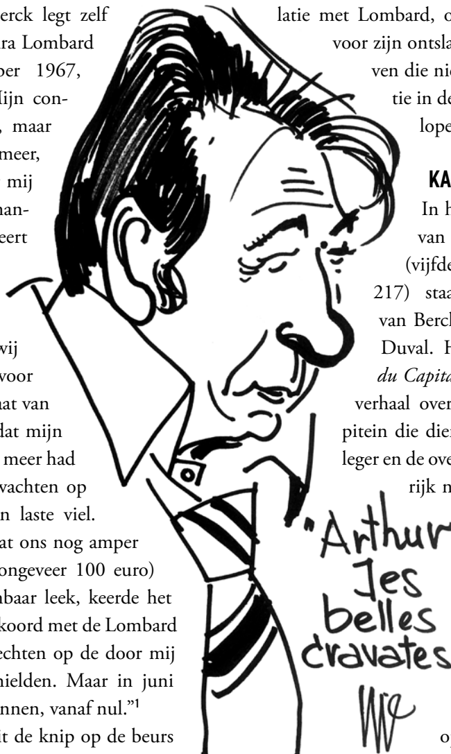
Karikatuur van Berck door Jijé, getekend op het stripfestival van Angoulême in 1975.

In het Pilote -kerstnummer van 19 december 1963 (vijfde jaargang, nummer 217) staan zes pagina's werk van Berck op scenario van Yves Duval. Het betreft Les Colères du Capitaine Racagnac , een kort verhaal over een lichtgeraakte kapitein die dienst deed in Napoleons leger en de overgang van diens keizerrijk naar het koninkrijk van Lodewijk XVIII maar moeilijk verteert. Het eerste verhaal is meteen avontuur aan een hoog tempo. De kapitein gaat nagevoel onmiddellijk op de vuist met enkele