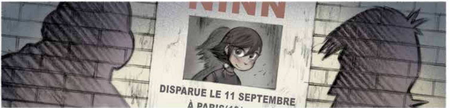
VERMIST OP 11 SEPTEMBER IN PARIJS