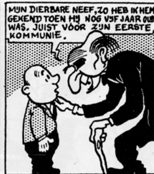
Het B-Gevaar, 1948 – stroken 25-26-27.