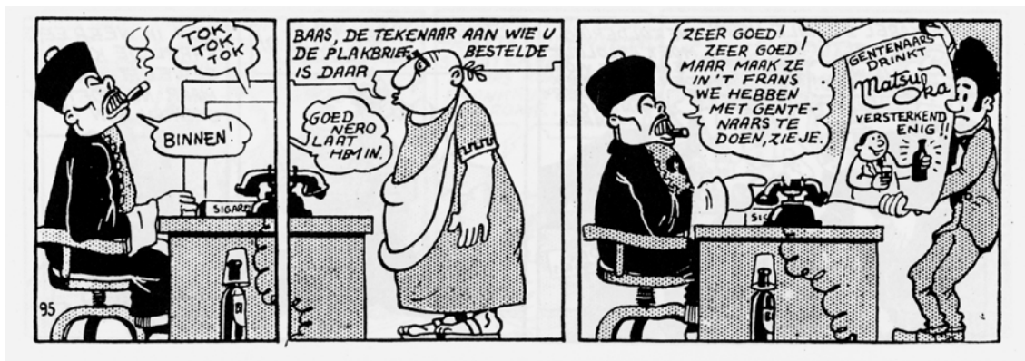
Het Geheim van Matsuoka, 1947-1948 – strook 95.

Belangrijk is ook het geografisch element, want al begint het verhaal in Brussel, de actie verplaatst zich naar Gent en nadien zelfs naar Brugge.