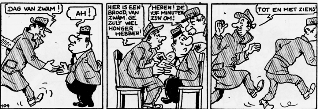
Het Geheim van Matsuoka, 1947-1948 – strook 101 tot 104.