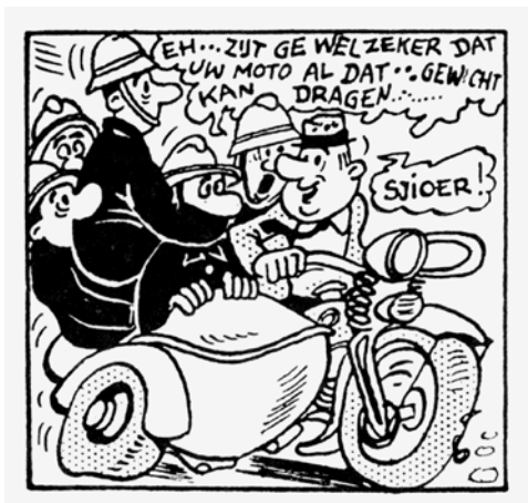
Het Geheim van Matsuoka, 1947-1948 – strook 144/3.

Dan is er ook nog het (getekend) decor, van ongere straatjes, krochten en steegjes, de stedelijke monumenten van Gent en Brugge, wat toch de opmerking staaft dat in de drie belangrijkste krantenstrips van die jaren (Suske en Wiske in De Standaard , Van Zwam in De Nieuwe Gids en Thomas Pips in Het Volk ), het stedelijk decor – Antwerpen, Brussel, Gent, etc – wel heel belangrijk was. Dat verdient een studie apart. Avis aux amateurs...