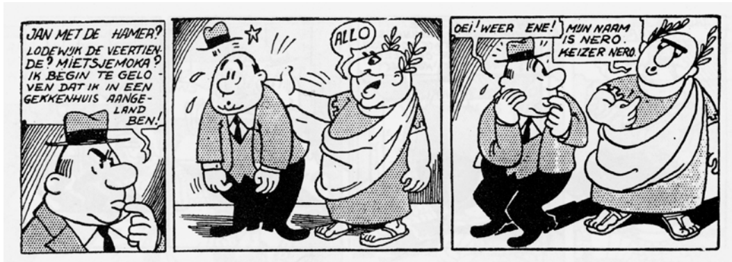
Het Geheim van Matsuoka, 1947-1948 – strook 9.

Het tafereeltje in het commissariaat wordt een motief dat we als terugkerende sekvens in latere verhalen makkelijk zullen herkennen (o.a. de eindsekvens van De ark van Nero ), net als we Marc Sleen, de auteur himself, meermaals zien interveniëren in het verhaal.