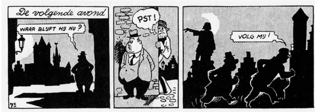
Het Geheim van Matsuoka, 1947-1948 – strook 75.

Dan is er ook nog het (getekend) decor, van ongere straatjes, krochten en steegjes, de stedelijke monumenten van Gent en Brugge, wat toch de opmerking staaft dat in de drie belangrijkste krantenstrips van die jaren (Suske en Wiske in De Standaard , Van Zwam in De Nieuwe Gids en Thomas Pips in Het Volk ), het stedelijk decor – Antwerpen, Brussel, Gent, etc – wel heel belangrijk was. Dat verdient een studie apart. Avis aux amateurs...