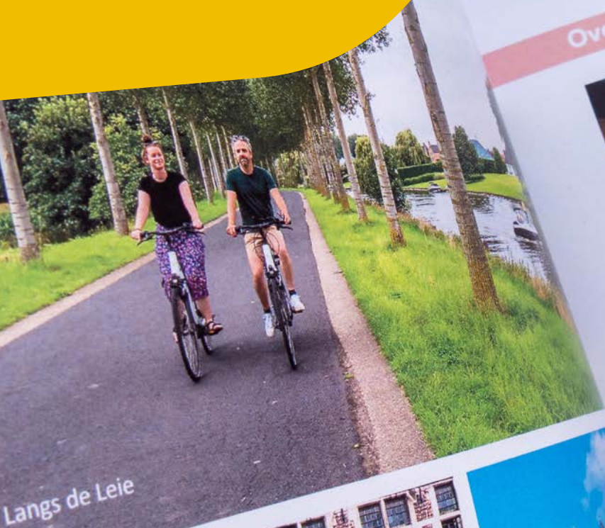
Langs de Leie

MET HONDERDEN FOTO'S EN PERSOON- LIJKE TIPS VAN TEAM REISREPORT