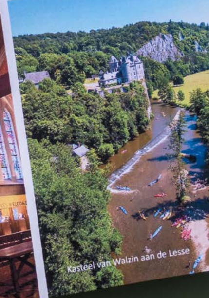
Kasteel van Walzin aan de Lesse