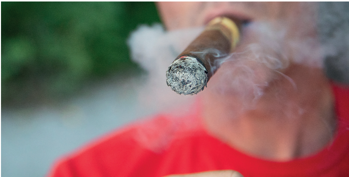
Eén van de do's.