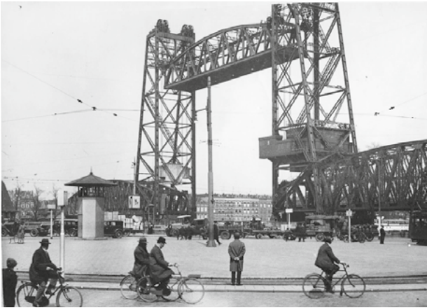
De Hef in 1932.