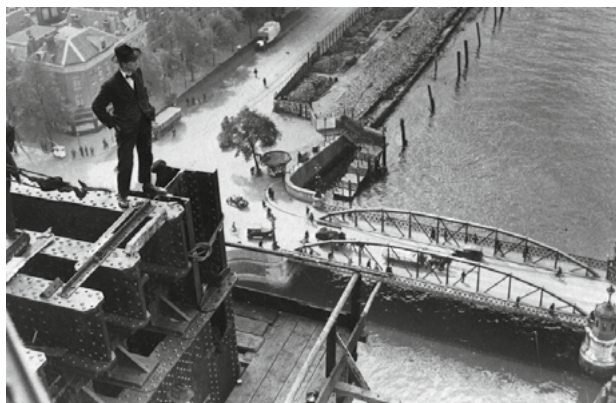
Man op De Hef tijdens de bouw van de heftorens (1926). Prentbriefkaart.